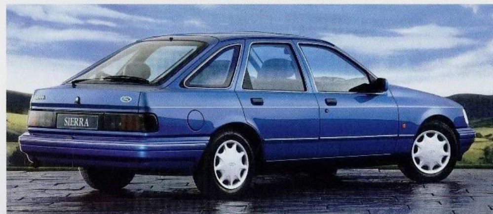
... oder aerodynamisches Fließheck.