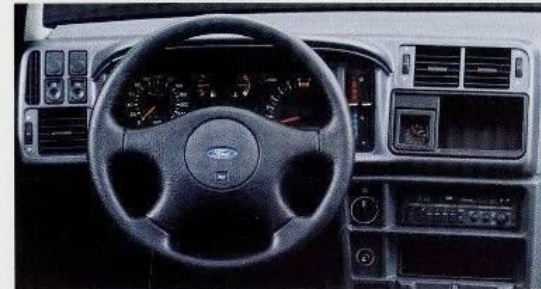
Das ergonomische Cockpit des Sierra Brillant. Das hochwertige Stereo-Radio-Cassettengerät 2004 sorgt für gute Unterhaltung.