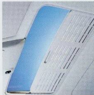
Serienmäßig Frischluft per Knopfdruck bietet das elektrische Schiebe-Hubdach.

Für ein gleichbleibend angenehmes Klima im Fahrzeuginnenraum sorgt die Ford-Klimaanlage (lieferbar in Verbindung mit dem 2,0i-DOHC-Motor) die Ihnen zum besonders günstigen Preis zur Verfügung steht. Die Ford Klimaanlage leistet mehr als nur ein prima Klima zur Sommerzeit ... fragen Sie Ihren Ford-Händler nach dem separaten Prospekt über Ford-Klimaanlagen.