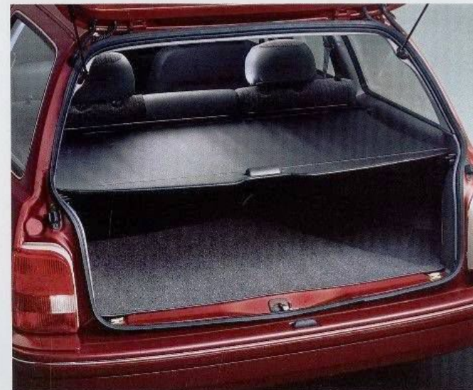
Die Laderaumabdeckung im Sierra Brilliant Turnier schützt Ihr Gepäck vor Einblicken.

Weitere Wunsch- ausstattungen (gegen Mehrpreis) stellt Ihnen Ihr Ford- Händler vor. Er informiert Sie auch gern über günstige Leasing- und Finanzierungsangebote der Ford Bank.