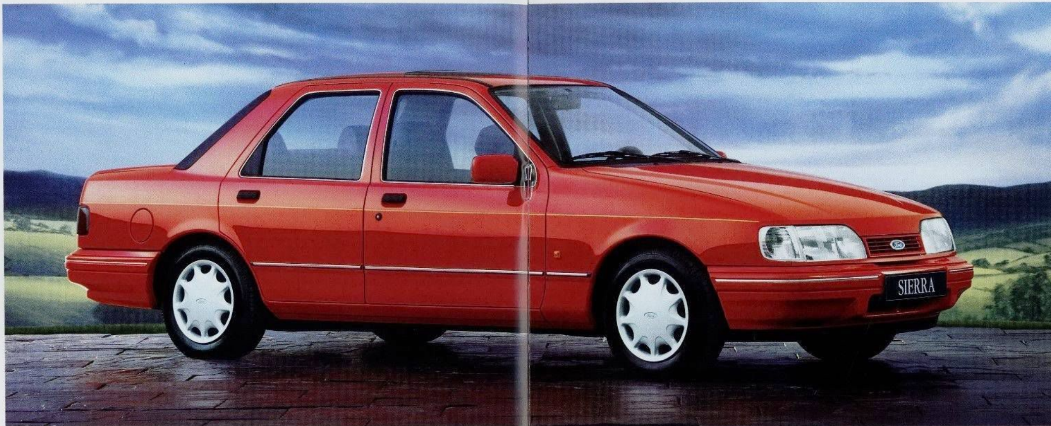
Schon im Stand macht der Sierra Brillant eine blendende Figur, ob als klassisches Stufenheck...