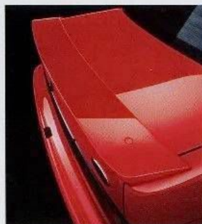
Der GT-Heckspoiler für die Limousinen. Mit dem GT-Sportpaket (gegen Mehrpreis) – in Verbindung mit dem 2,0i-DOHC-Motor – können Sie Ihren Sierra Brillant noch individueller gestalten.

Bei Zulassung bis zum 31.7.1992 ist der 1,8-Liter-Turbodiesel mit Oxidationskatalysator für ein Jahr von der Kfz-Steuer befreit.