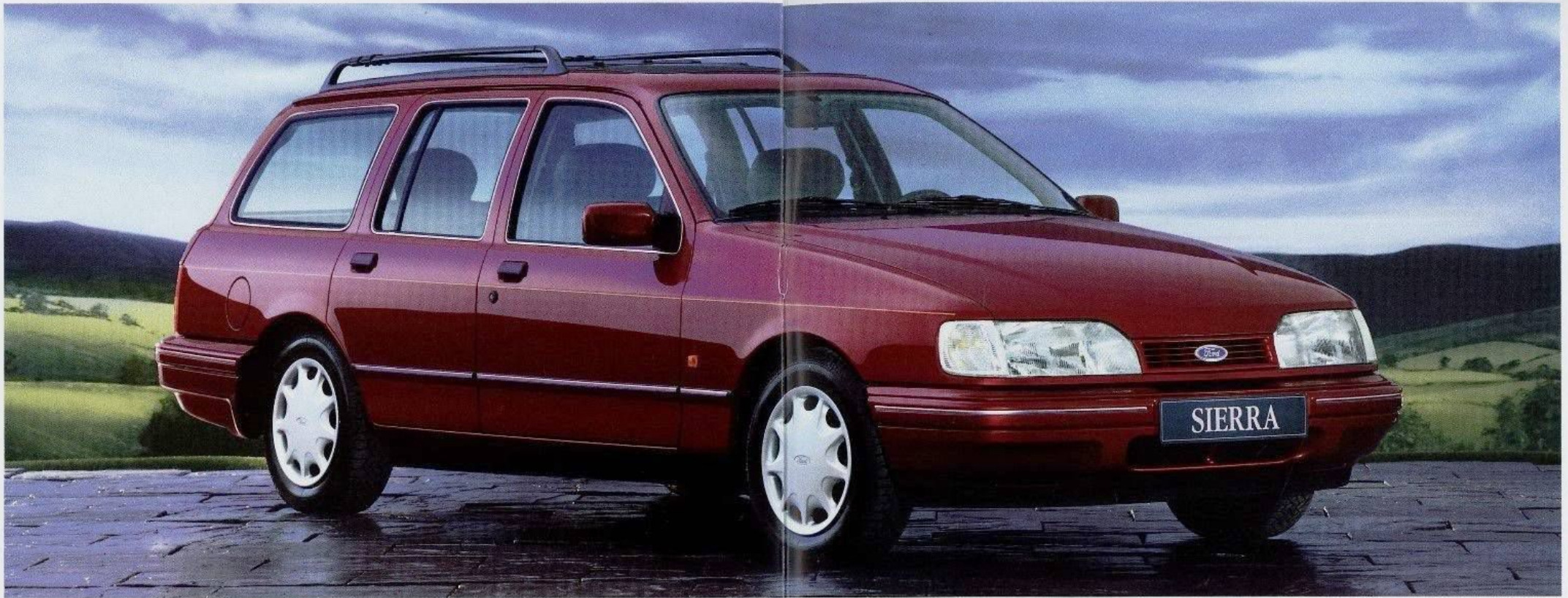
Der neue Sierra Brilliant Turnier ist das ideale Fahrzeug für Familien- und Geschäftsreisen.