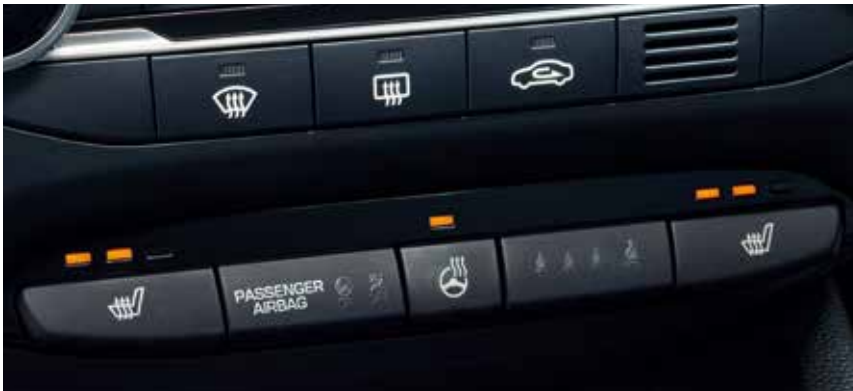
Sitzheizung, vorne/beheizbares Lederlenkrad. 1,2