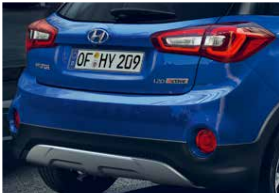
LED-Rückleuchten 1 und Nebelschlussleuchte.