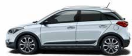
Clean Slate Metallic 1