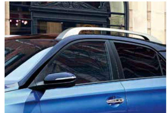
Dachträger in Silber und Dach in Phantom Black. 1