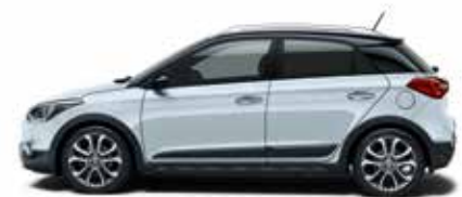
Clean Slate Metallic