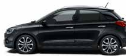
Phantom Black Mineraleffekt 1