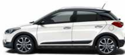
Polar White Uni