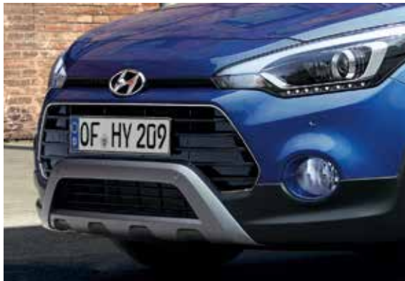
Kaskaden-Kühlergrill mit Unterfahrschutz und runden Nebelscheinwerfern. 1

Der Hyundai i20 Active kombiniert das smarte Design der i20 Reihe mit Offroad-Elementen. Durch Features wie den Unterfahrschutz und das überarbeitete Fahrwerk, das für mehr Bodenfreiheit und eine erhöhte Sitzposition sorgt, ist der Hyundai i20 Active für jedes Abenteuer bereit.