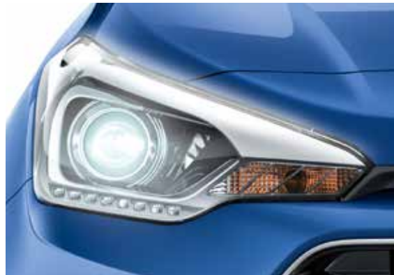
Frontscheinwerfer mit LED-Tagfahrlicht. 1