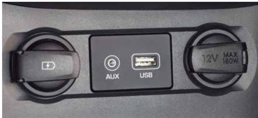
AUX-Anschluss und USB-Anschlüsse. 1

Nahtlose Konnektivität, wie man sie von einem smarten Fahrzeug erwartet – das bietet Ihnen der Hyundai i20 Active. Der 7-Zoll-Touchscreen 1 ist für optimalen Zugriff mittig platziert. Er unterstützt Apple CarPlay™ 1,2 und Android Auto™ 1,2 . Mit ihm lassen sich Musik, Smartphone- und App-Funktionen über den Bildschirm steuern. Außerdem steht als weitere Anschlussmöglichkeit ein AUX-Eingang 1 zur Verfügung – ebenso wie ein USB-Anschluss 1 , mit dem Sie Ihre Audiodateien auch im Auto abspielen können.