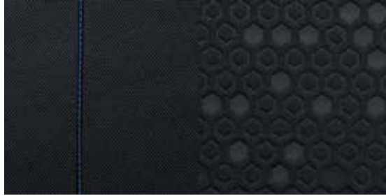
Stoff in Schwarz mit blauen Ziernähten 2 Stoff in Schwarz mit roten Ziernähten 2