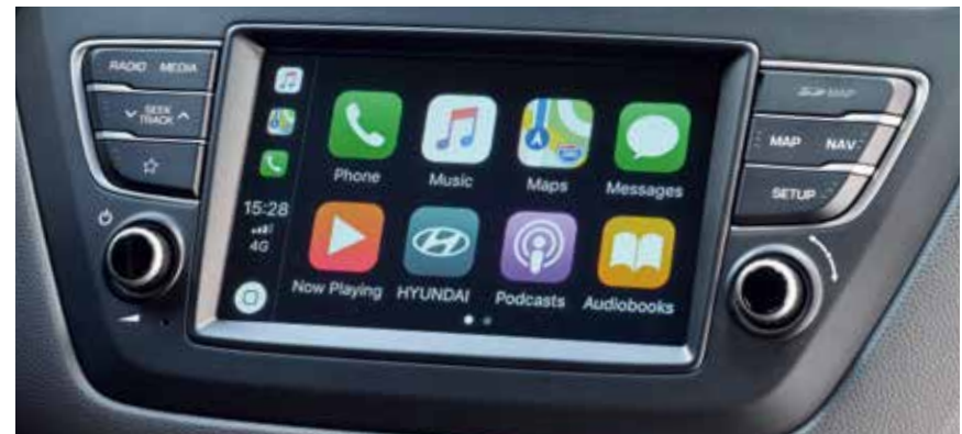
7-Zoll-Touchscreen 1 mit Apple CarPlay™ und Android Auto™.