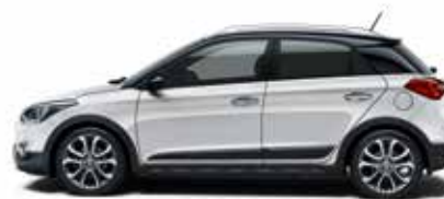
Sleek Silver Metallic