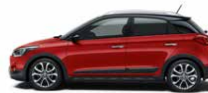
Dragon Red Mineraleffekt

Abweichungen sind drucktechnisch bedingt. Für weitere Informationen stehen unsere Vertragshändler gerne zur Verfügung. Für Druckfehler übernehmen wir keine Gewähr.