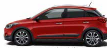
Dragon Red Mineraleffekt 1