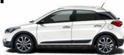
Polar White Uni 1