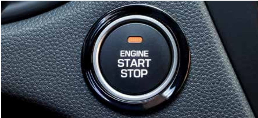
Smart-Key-System mit Start-/Stopp-Knopf. 1

Mit dem Hyundai i20 Active unterwegs zu sein ist immer ein (Fahr)Vergnügen, unter anderem dank einer Komfortausstattung, mit der er sich an die individuellen Wünsche seines Fahrers anpassen lässt. Entspanntes Ankommen hat schließlich auch viel mit dem angenehmsten Weg zum Ziel zu tun.