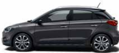
Star Dust Metallic 2