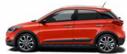
Tomato Red Uni