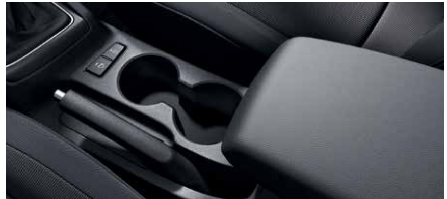
Getränkehalter/Mittelarmlehne mit Ablagefach.