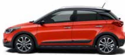
Tomato Red Uni