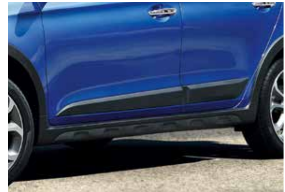
Seitenschweller mit schwarzem Kunststoffschutz.