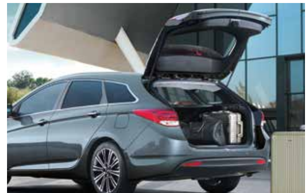
Berührungsloses Öffnen der Heckklappe. 1 Die Heckklappe öffnet sich automatisch, wenn man sich mit dem Fahrzeugschlüssel nähert, und ermöglicht den mühelosen Zugang zum geräumigen Laderaum.