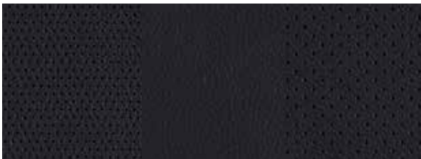
Leder 2 Schwarz 1