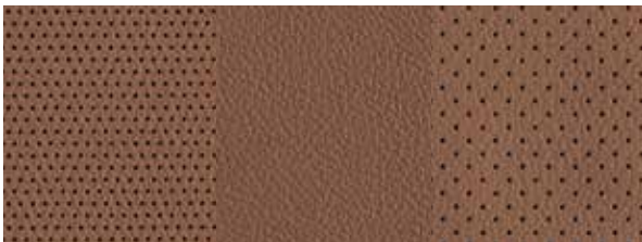
Leder 2 Braun 1