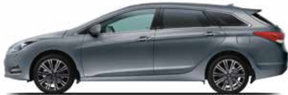
Titanium Silver Metallic 1