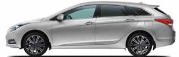
Platinum Silver Metallic 1