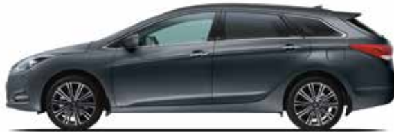
Ocean View Mineraleffekt 1