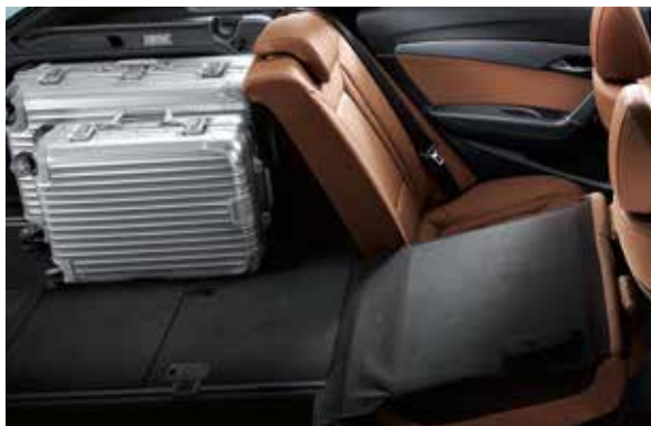
Variabler Laderaum. Mit einem Handgriff lassen sich die Rücksitzlehnen im Verhältnis 60:40 geteilt umlegen. So reicht der Platz für beides, ein oder zwei Mitfahrer im Fond und das große Gepäck. Bei vollständig umgeklappten Sitzen erweitert sich das Ladevolumen auf 1.719 Liter.