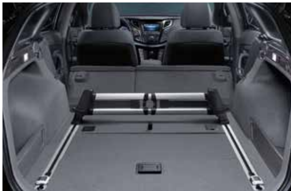
Sicher und ordentlich – Laderaum mit Gepäckschiensystem. Der riesige Laderaum fasst 553 Liter Gepäck und die ausziehbare Laderaumabdeckung macht es unsichtbar. Mit dem Gepäckschiensystem kann die Ladung gut gegen Verrutschen gesichert werden.

Die dynamischen Linien des Hyundai i40 Kombi umschließen das geräumige Interieur und den Laderaum des Klassenbesten. Genießen Sie die Qualität und den Komfort des Hyundai i40 Kombi mit so viel oder so wenig Gepäck, wie Sie mögen. Dank elektrischer Heckklappe und dem Gepäckschiensystem ist der Kofferraum gut zugänglich und optimal nutzbar. Die elektronische Fahrwerkregelung passt die Federungscharakteristik der Hinterachse dem Beladungszustand an.