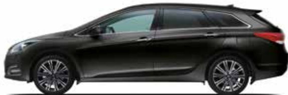
Phantom Black Mineraleffekt 1