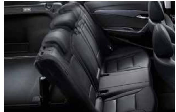
Elektronische Dämpfungssteuerung der Hinterachse. Die elektronische Fahrwerkregelung passt die Dämpfungscharakteristik der jeweiligen Fahrsituation, gemäß dem Beladungszustand und dem gewählten Fahrmodus an.