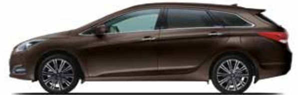
Tan Brown Mineraleffekt 1