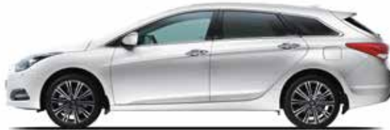
White Crystal Mineraleffekt 1