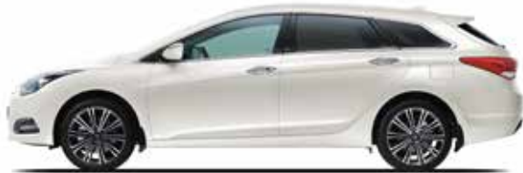
Pure White Uni

So individuell wie Ihr Geschmack und Ihre Vorlieben, so vielfältig ist die Auswahl an Lackierungen für den Hyundai i40 Kombi in Verbindung mit drei verschiedenen Interieur-Farbvarianten. Zusammen mit der Auswahl an Sonderausstattungen und Zubehör entsteht so ein Fahrzeug mit Ihrer ganz persönlichen Note. Der Hyundai-Händler in Ihrer Nähe wird Sie gern zu den möglichen Kombinationen beraten.