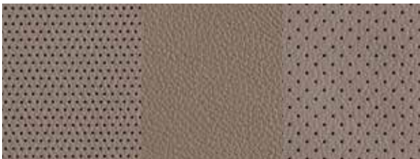
Leder 2 Beige 1