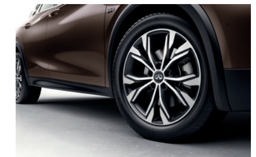
18-ZOLL-LEICHTMETALLFELGEN IM 5-DOPPELSPEICHER-DESIGN, SCHNEEFLOCKENDESIGN, 235/50R18-REIFEN

INFINITI Europe, Geschäftsbereich der Nissan International SA, CH-550-1047524-0, Z.A. la Pièce – Bât. B2, Route de l'Etraz, 1180 Rolle, Schweiz