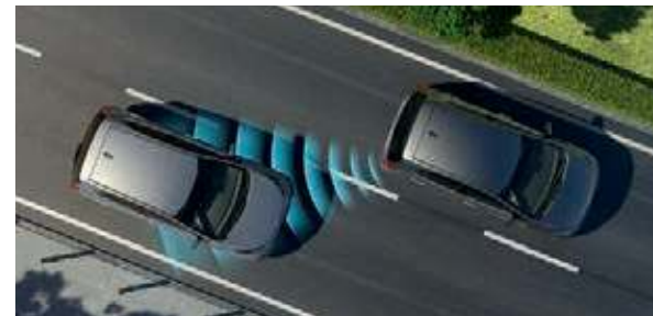
Spurwechselassistent mit Totwinkelwarner AA . Mithilfe von Radarsensoren erkennt das BCW-System (Blind-Spot Collision Warning) herannahende Fahrzeuge im Bereich des toten Winkels und warnt dich bei Bedarf optisch und akustisch davor, die Fahrspur zu wechseln. Solltest du es dennoch versuchen, erfolgt bei den Ausführungen mit AMT-Getriebe automatisch ein Lenk- und Bremsengriff, um eine Kollision zu vermeiden.