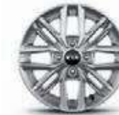
14-Zoll- Leichtmetallfelgen (optional für Vision)