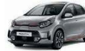
Sparklingsilber Met. (KCS)