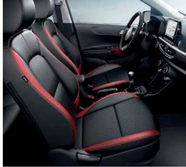
Sitzbezüge in hochwertiger Ledernachbildung: Seitenwangen in Rot; rote Nähte (GT-line)