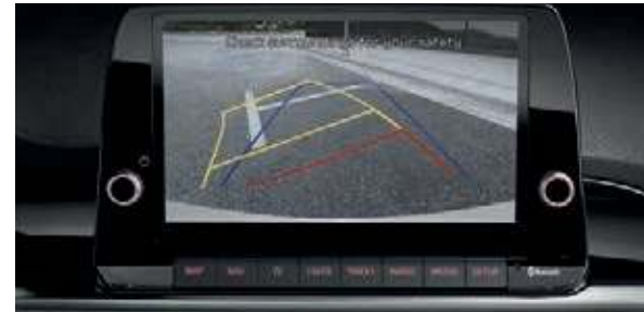
Rückfahrkamera mit dynamischen Hilfslinien AA . Beim Rückwärtsfahren erscheinen auf dem Touchscreen* des Audio- oder Navigationssystems die Kamerabilder inklusive Hilfslinien, die dir das Manövrieren erleichtern.