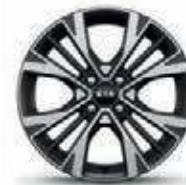
16-Zoll- Leichtmetallfelgen (GT-line)

Bei einigen unserer modernen Metallicfarben werden bewusst unterschiedliche Farbpigmente verwendet. Dadurch können unter bestimmten Lichtverhältnissen, z. B. direktes Sonnenlicht, attraktive Farbeffekte erzielt werden. Zum Teil kann die Farbe changieren, z. B. von Schwarz zu Dunkelblau. Bei den hier abgebildeten Farbdarstellungen kann es aufgrund der Drucktechnik zu Abweichungen zu den Originalfarben kommen. Weitere Informationen zu den Farbeffekten und Grundfarben erhältst du bei deinem Kia-Partner. Metalllackierungen sind aufpreispflichtig.