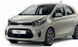
Milky Beige Met. (M9Y)