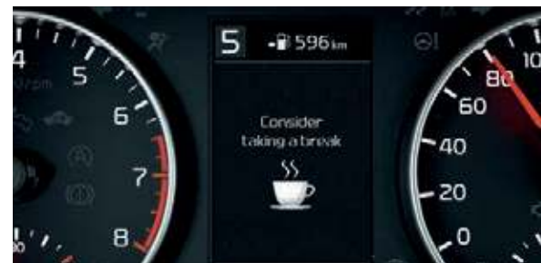
Müdigkeitwarner AA . Der Müdigkeitwarner (Driver Attention Warning, DAW) analysiert ständig verschiedene Fahrzeugparameter wie die Betätigung von Lenkrad und Blinker. Erkennt das System bei dir Zeichen von Erschöpfung, weist es dich durch einen Warnton und eine Anzeige in der Instrumenteneinheit darauf hin.