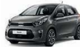
Astrograu Met. (M7G)