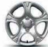
14-Zoll- Stahlfelgen mit Radabdeckung (Vision)