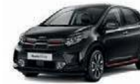
Auroraschwarz Met. (ABP)