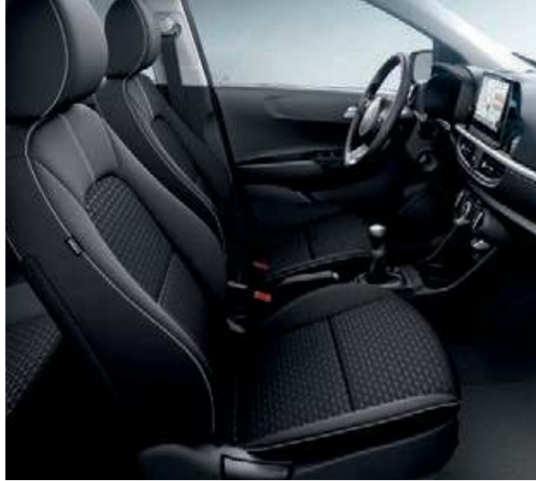
Sitzbezüge in Stoff (Vision)