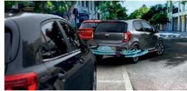
Parkensensoren hinten AA . Rückwärts einparken ohne Angst vor Beulen oder Kratzern: Ein Signalton warnt dich, wenn du einem Fahrzeug oder einem Hindernis zu nahe kommst.