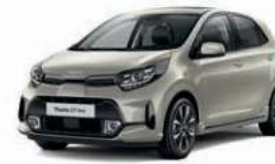
Milky Beige Met. (M9Y)