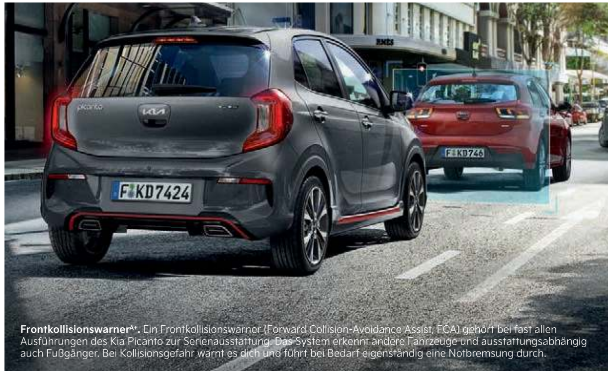
Frontkollisionwarner AA . Ein Frontkollisionwarner (Forward Collision-Avoidance Assist, FCA) gehört bei fast allen Ausführungen des Kia Picanto zur Serienausstattung. Das System erkennt andere Fahrzeuge und ausstattungsabhängig auch Fußgänger. Bei Kollisionsgefahr warnt es dich und führt bei Bedarf eigenständig eine Notbremsung durch.