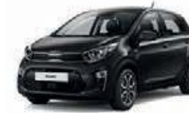
Auroraschwarz Met. (ABP)