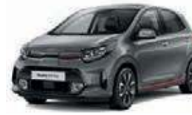
Astrograu Met. (M7G)