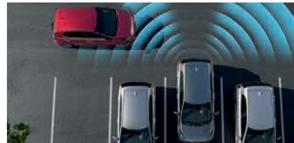
Querverkehrwarner AA . Beim Zurücksetzen aus Parklücken oder Einfahrten warnt dich der Querverkehrwarner (Rear Cross-Traffic Collision Warning, RCCW) durch optische und akustische Signale vor Fahrzeugen, die deinen Weg kreuzen. Bei den Ausführungen mit AMT-Getriebe erfolgt zudem automatisch ein Bremsengriff, wenn die Notbremsfunktion aktiviert ist.