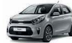
Sparklingsilber Met. (KCS)