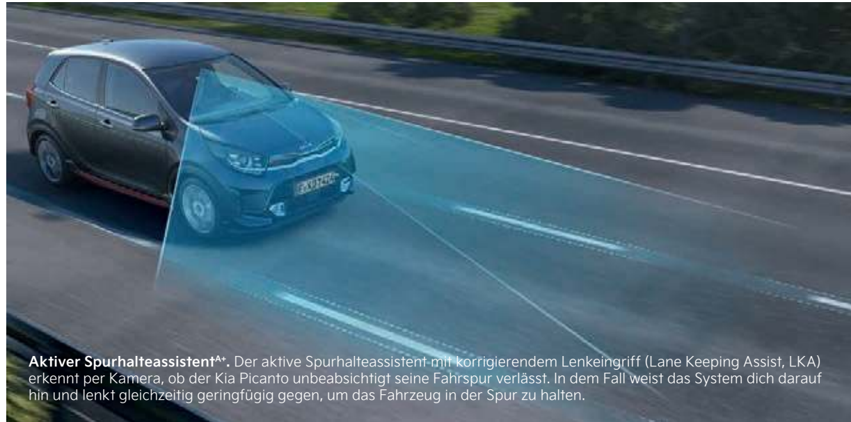
Aktiver Spurhalteassistent AA . Der aktive Spurhalteassistent mit korrigierendem Lenkeingriff (Lane Keeping Assist, LKA) erkennt per Kamera, ob der Kia Picanto unbeabsichtigt seine Fahrspur verlässt. In dem Fall weist das System dich darauf hin und lenkt gleichzeitig geringfügig gegen, um das Fahrzeug in der Spur zu halten.

Autofahren kann so schön sein. Aber sicher kennst du die Schreckmomente, wenn vor dir auf der Fahrbahn plötzlich etwas auftaucht oder du erst im letzten Moment bemerkst, dass sich im toten Winkel ein Fahrzeug nähert. Um dir solche Situationen zu ersparen oder sie zumindest zu entschärfen, bietet dir der Kia Picanto hochmoderne Fahrerassistenzsysteme. Sie beobachten kontinuierlich ihren jeweiligen Überwachungsbereich und liefern dir wichtige Informationen und Warnhinweise. Darüber hinaus treffen sie im Gefahrenfall blitzschnelle Entscheidungen, um drohende Kollisionen zu vermeiden oder deren Folgen abzumildern.