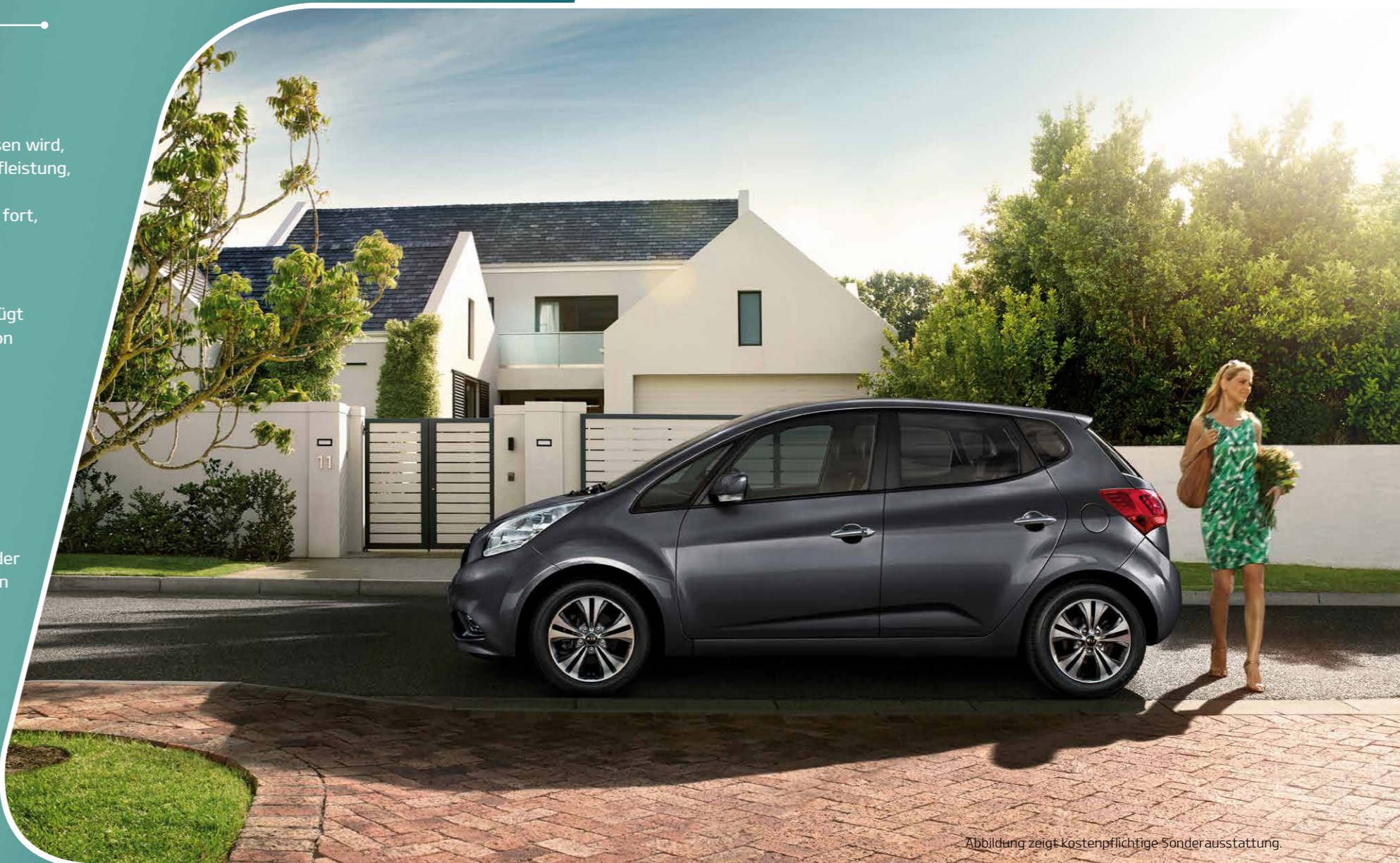
Abbildung zeigt kostenpflichtige Sonderausstattung.