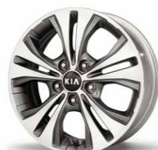
16-Zoll-Leichtmetallfelgen mit Bereifung 205/55 R16 (Serie für SPIRIT mit Automatikgetriebe und DREAM-TEAM EDITION)