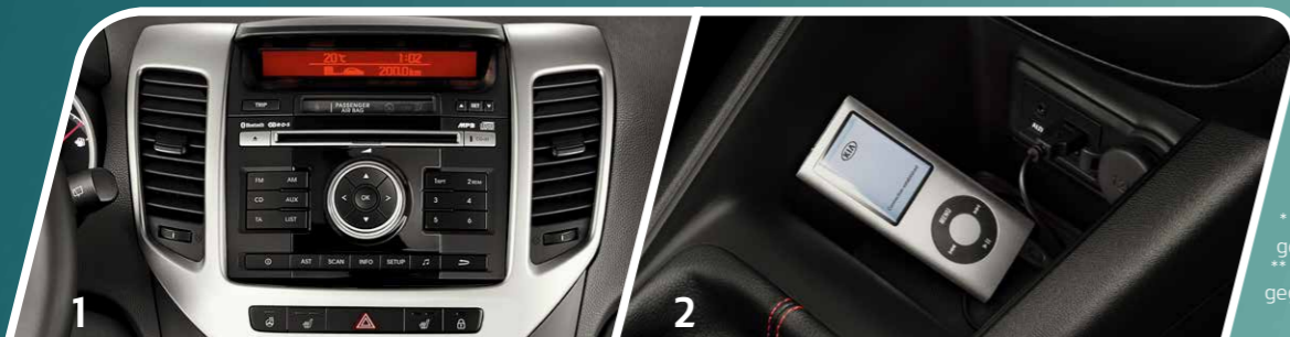
* Abhängig von gewählter Ausstattung ** Je nach Ausstattung gegen Aufpreis erhältlich

Der Kia Venga hat beste Verbindungen – und nutzt sie für sein Infotainment-Angebot. Das beginnt bei den USB- und AUX-Anschlüssen für das serienmäßige Audiosystem mit sechs Lautsprechern, das mit einer externen 300-Watt-Premium-Endstufe die Kabine zum Konzertsaal macht. Hinzu kommt die Bluetooth®-Freisprecheinrichtung, die das Telefonieren während der Fahrt ermöglicht, und das Navigationssystem, das Sie zielsicher auch durch abgelegene Gegenden lotst.