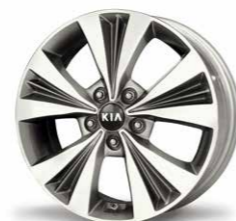
17-Zoll-Leichtmetallfelgen mit Bereifung 205/50 R17 (Serie für SPIRIT mit Schaltgetriebe und PLATINUM EDITION)