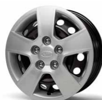
15-Zoll-Stahlfelgen mit Radabdeckung und Bereifung 195/65 R15 (Serie in ATTRACT und EDITION 7)