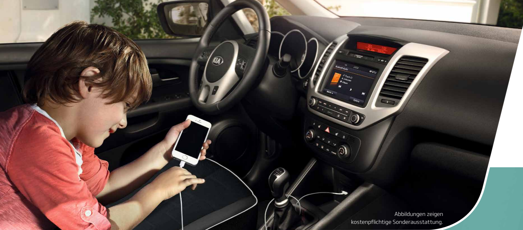
Abbildungen zeigen kostenpflichtige Sonderausstattung.