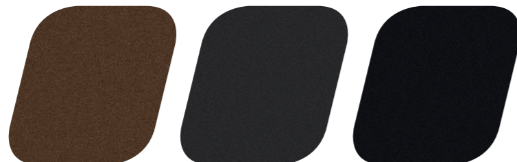
Sandbeige Metallic (D5U)