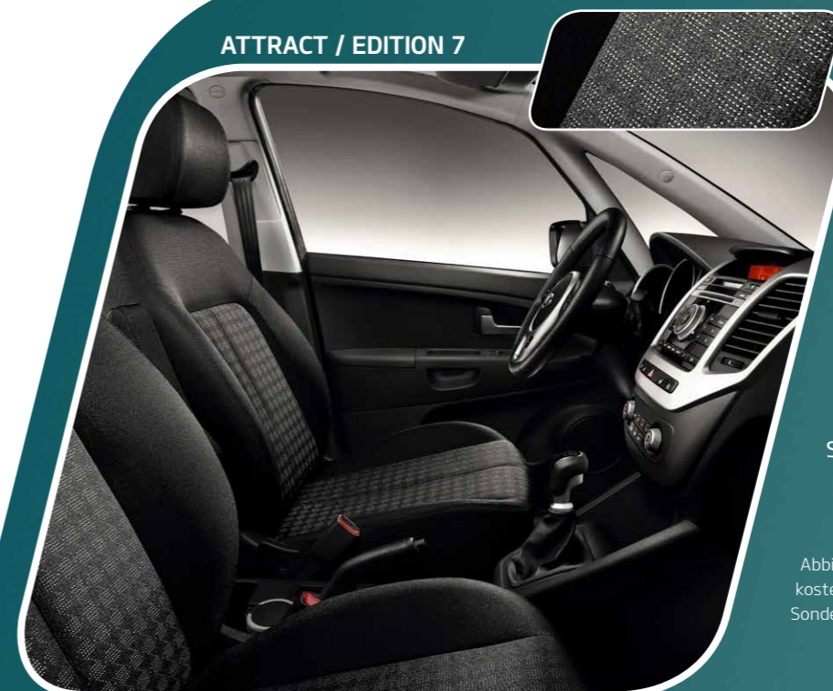
ATTRACT / EDITION 7