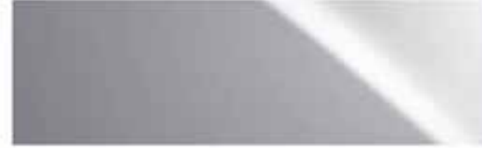
Satinsilber* | 1J2