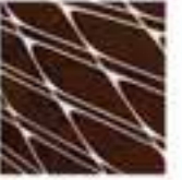
Laser Cut, L-finesse