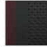
Karminrot und Samtschwarz