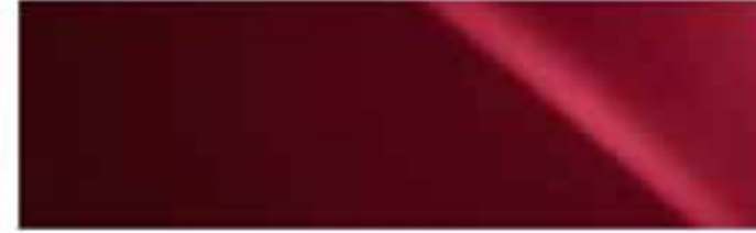
Florentinerrot* | 3R1