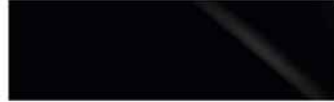
Onyxschwarz | 212