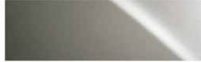
Titaniumsilber* | 1J7