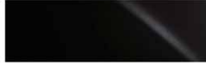
Graphitschwarz* | 223