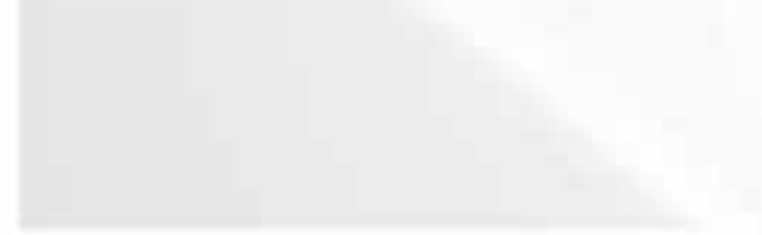
Fujiweiß* | 083