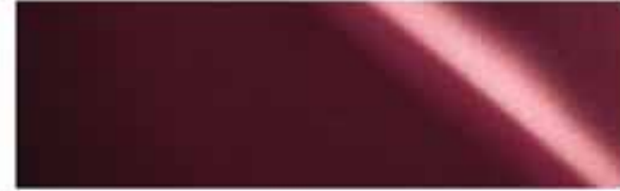
Achatrot* | 3U3