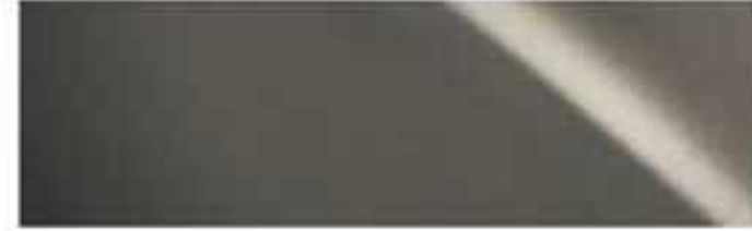
Mangangrau* | 1K2