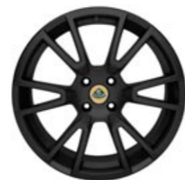
Standard Elise SC Y Typ 6-Speichen Leichtmetall-Gussfelgen in Schwarz als Bestandteil des Pakets