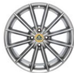
Standard Elise 12-Speichen Leichtmetall-Gussfelgen in Hi-power Silber