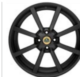
Standard Elise R 8-Speichen Leichtmetall-Gussfelgen in Schwarz als Bestandteil des Pakets