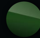
British Racing Green