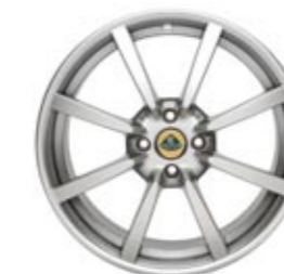
Standard Elise R 8-Speichen Leichtmetall-Gussfelgen in Hi-power Silber