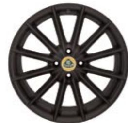
Standard Elise 12-Speichen Leichtmetall-Gussfelgen in Schwarz als Bestandteil des Pakets