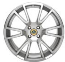
Standard Elise SC Y Typ 6-Speichen Leichtmetall-Gussfelgen in Hi-power Silber

Schwarzlackierte Felgen und schwarzlackierter Heckdiffusor