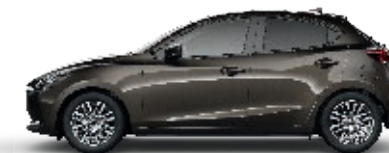
OBSIDIANGRAU METALLIC (42S)