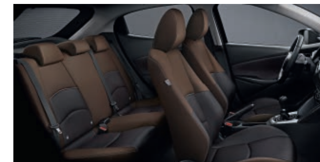
Stoffbezug in Braun