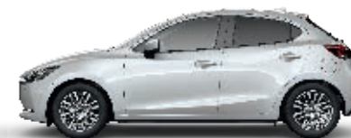
SATINWEISS METALLIC (25D)