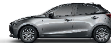
MATRIXGRAU METALLIC (46G)