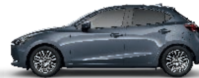
POLYMETAL GRAU METALLIC (47C)