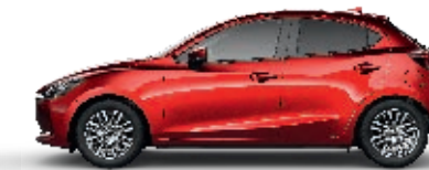
MAGMAROT METALLIC (46V)