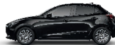
ONYXSCHWARZ METALLIC (41W)