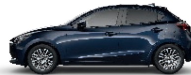
MITTERNACHTSBLAU METALLIC (42M)