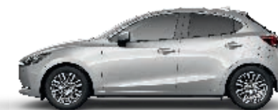
MONDSTEINWEISS METALLIC (47A)