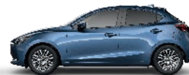
TURMALINBLAU METALLIC (45B)