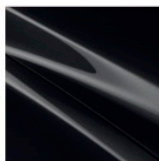
Onyxschwarz Metallic (41W)