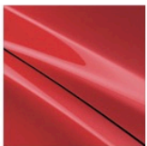
Sonderfarbe: Rubinrot Metallic (41V)