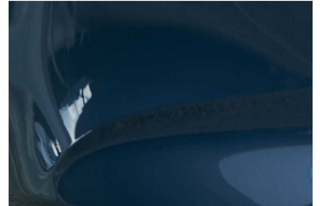
Polymetal Grau Metallic