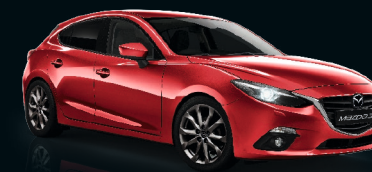
RUBINROT METALLIC (41V), Sonderfarbe