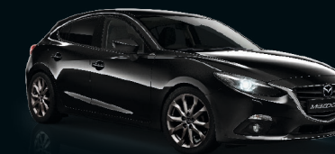
ONYXSCHWARZ METALLIC (41W)

Neun Farben stehen Ihnen zur Auswahl. Setzen Sie eher auf klassisches Understatement oder bevorzugen Sie lässiges Selbstbewusstsein?