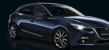
MITTERNACHTSBLAU METALLIC (42M)