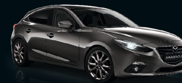
OBSIDIANGRAU METALLIC (42S)