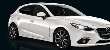
SATINWEISS METALLIC (25D)