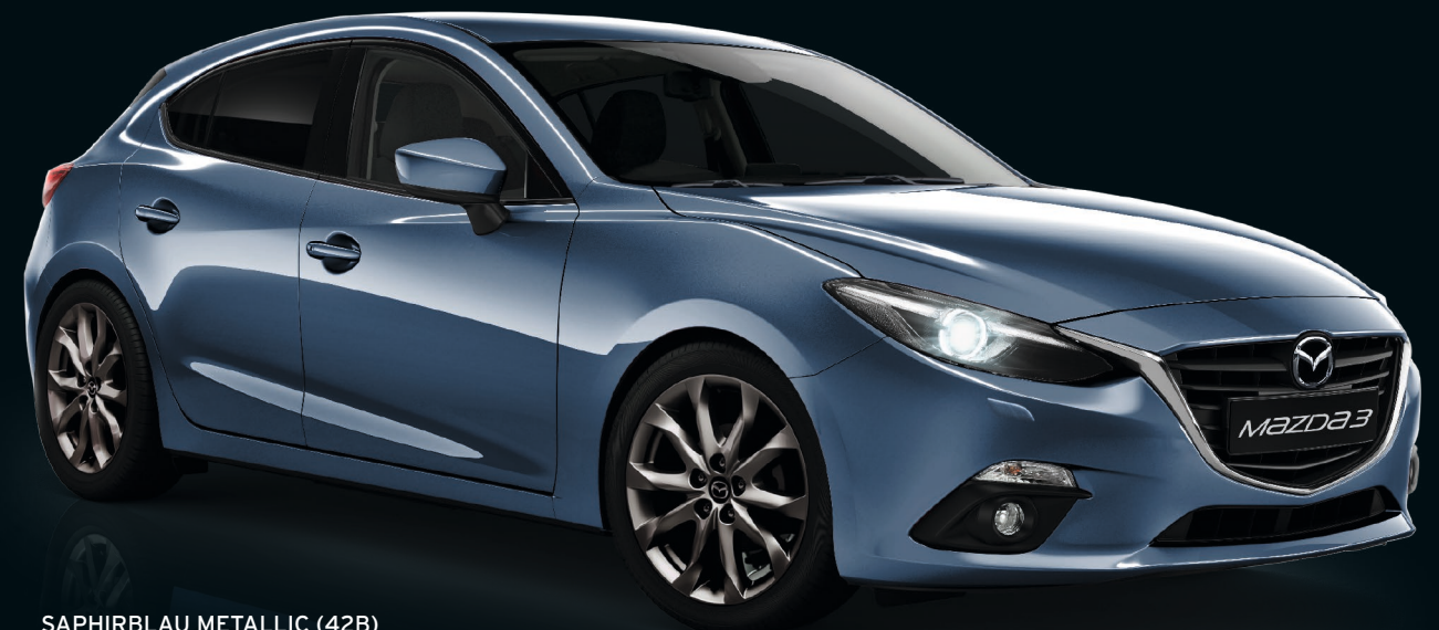
SAPHIRBLAU METALLIC (42B)

Neun Farben stehen Ihnen zur Auswahl. Setzen Sie eher auf klassisches Understatement oder bevorzugen Sie lässiges Selbstbewusstsein?