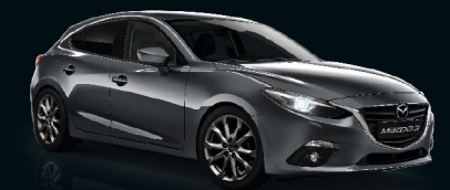
GRAPHITGRAU METALLIC (42A)