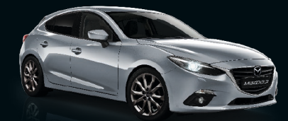
PLUTOSSILBER METALLIC (38P)