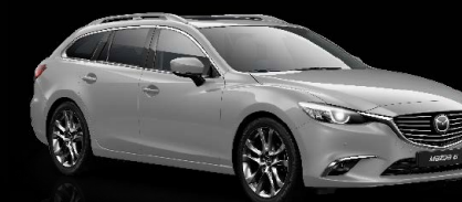
DIAMANTSILBER METALLIC (45P)