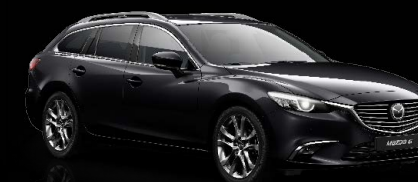
ONYXSCHWARZ METALLIC (41W)

Souveränes Understatement oder entspanntes Durchsetzungsvermögen? Neun Farben stehen Ihnen für Ihren Gefährten zur Verfügung – neun spannende Ausdrucksmöglichkeiten.