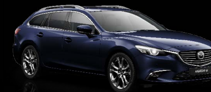
MITTERNACHTSBLAU METALLIC (42M)