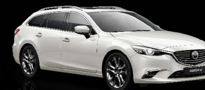
SATINWEISS METALLIC (25D)