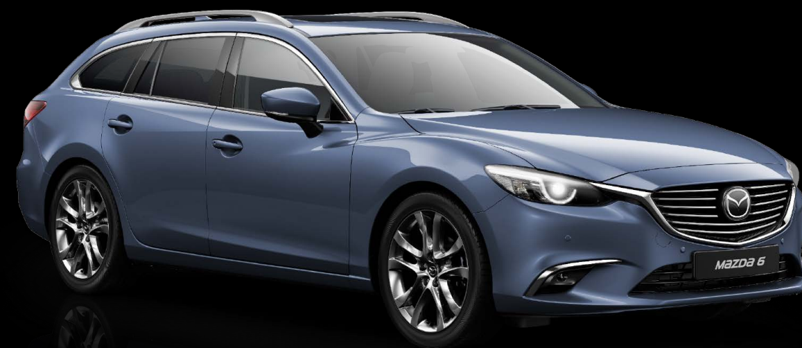
SAPHIRBLAU METALLIC (42B)

Souveränes Understatement oder entspanntes Durchsetzungsvermögen? Neun Farben stehen Ihnen für Ihren Gefährten zur Verfügung – neun spannende Ausdrucksmöglichkeiten.