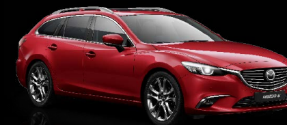
RUBINROT METALLIC (41V)