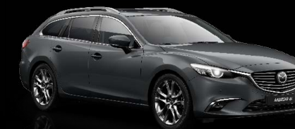
MATRIXGRAU METALLIC (46G)