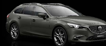
OBSIDIANGRAU METALLIC (42S)