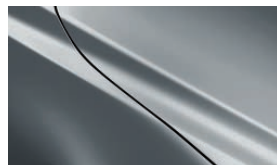
MONDSTEINWEISS METALLIC (47A)