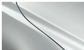
SATINWEISS METALLIC (25D)