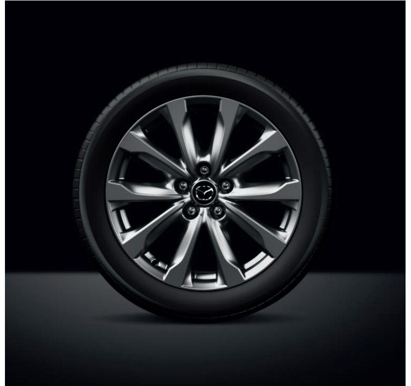
18-ZOLL LEICHTMETALLFELGEN MIT HOCHGLANZBESCHICHTUNG