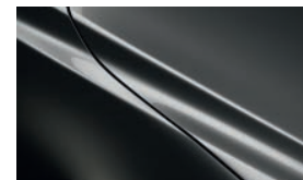
MATRIXGRAU METALLIC** (46G)