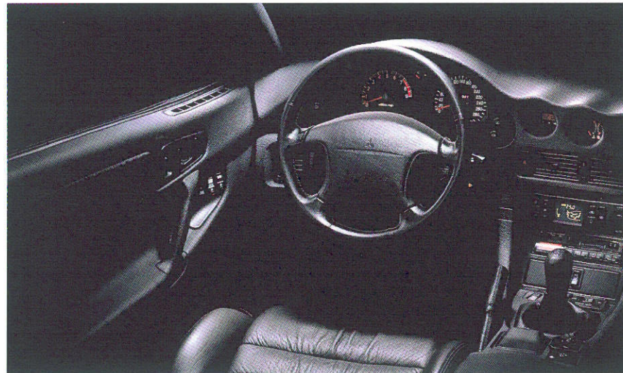
Abb.: Sonderausstattung Radio

Servounterstützte Allradlenkung ● 4-Speichen-Lenkrad (Lenkradkranz mit Leder bezogen) ● Fahrer- und Beifahrer-Airbag ● Tempoautomatik ● Funktionsüberwachung für Bremsflüssigkeit, Türschließung, Kraftstoffreserve, Handbremse, ABS, Airbag, Motorölstand ● Schadstoff-Check-Diagnose (SCD) ● Drehzahlmesser und Öldruckmesser ● Quarz-Digital-Uhr ● Vollautomatische Klimaanlage ● 10-stufiges Gebläse mit Innenluftumwälzung ● Elektrische Scheibenheber ● Zentralverriegelung für seitliche Türen ● Verstärkter Flankenschutz in den Seitentüren ● Sitze vorn mit Sitzheizung und in Lederausstattung ● Fahrersitz mit elektrisch verstellbarer Seiten- und Wirbelsäulenstütze, elektrisch längsverstellbar, Sitzfläche elektrisch höhen- und neigungsverstellbar ● Sitze hinten mit hochwertigem Vinylbezug ● Rückenlehne hinten einzeln umklappbar (50:50) ● Vier Dreipunkt-Automatik-Gurte ● 2 höhen- und neigungsverstellbare Kopfstützen ● Innenbeleuchtung und Fußraumleuchte mit automatischem Dimmer ● Zusätzliche Leseleuchten, Motorraumbeleuchtung ● Sonnenblenden mit Make-up Spiegel ● Armlehne zwischen den Vordersitzen ● Ablagefach in vorderer Mittelarmlehne ● Mittelkonsole mit Ablagefach ● Fußstütze/Fahrerseite ● Leuchten in den Türen ● 6 Lautsprecher ● Kofferraum beleuchtet und verkleidet