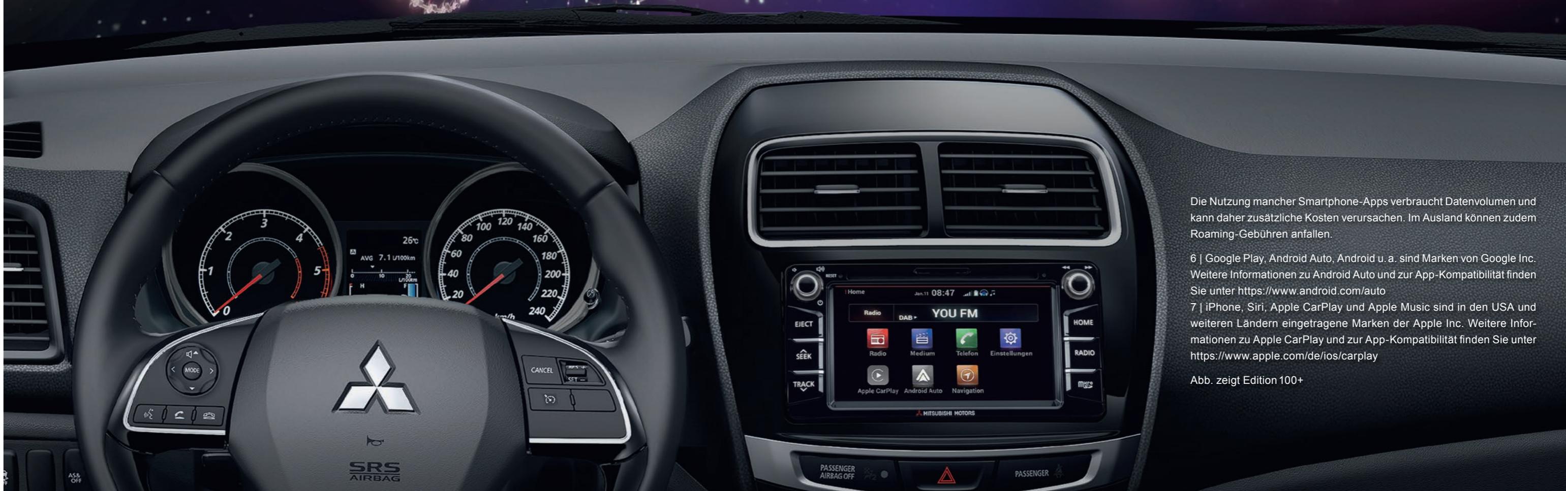
Abb. zeigt Edition 100+

7 | iPhone, Siri, Apple CarPlay und Apple Music sind in den USA und weiteren Ländern eingetragene Marken der Apple Inc. Weitere Informationen zu Apple CarPlay und zur App-Kompatibilität finden Sie unter https://www.apple.com/de/ios/carplay