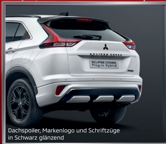
Dachspoiler, Markenlogo und Schriftzüge in Schwarz glänzend