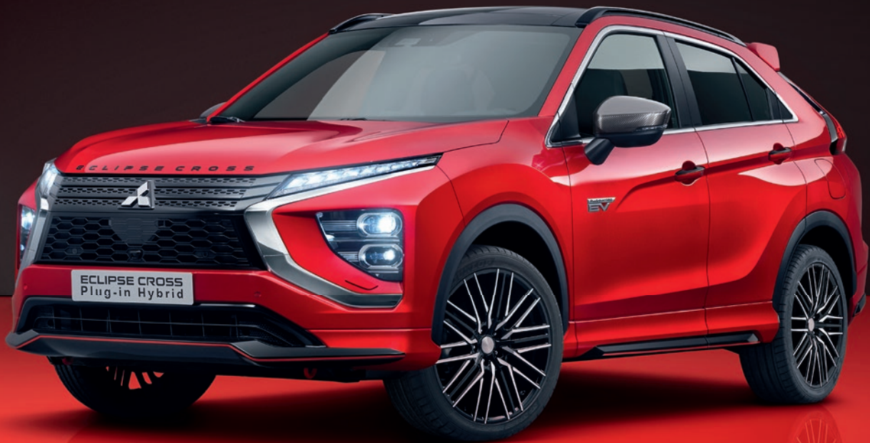
Abb. zeigt Serienfahrzeug mit nachträglich angebrachtem Zubehör