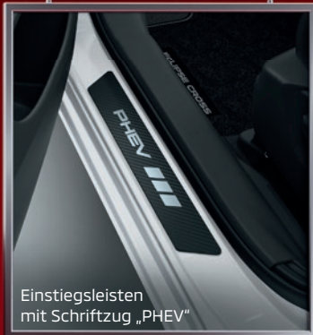
Einstiegsleisten mit Schriftzug „PHEV“