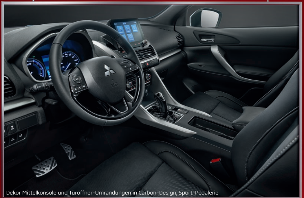
Dekor Mittelkonsole und Türöffner-Umrandungen in Carbon-Design, Sport-Pedalerie