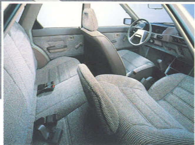
Abbildungen Oben: Lancer Combi 1500 GLX Sonderausstattung Radblenden Mitte: Lancer Combi 1500 GLX