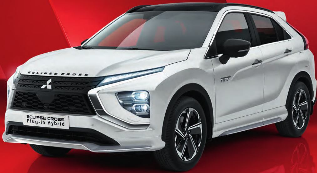
Abb. zeigt Serienfahrzeug mit nachträglich angebrachtem Zubehör