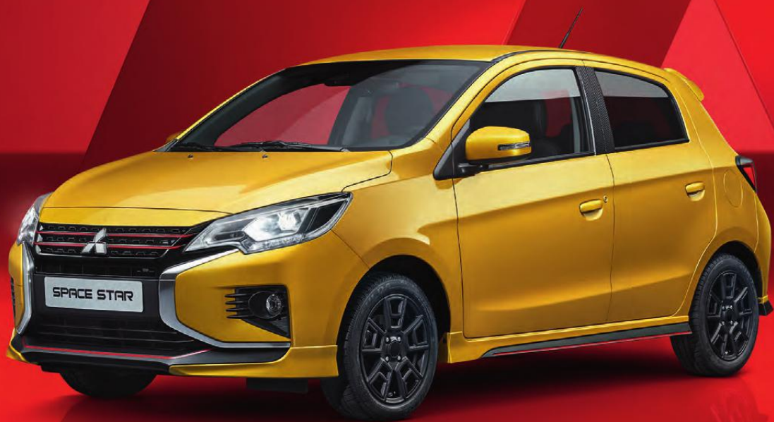
Abb. zeigt Serienfahrzeug mit nachträglich angebrachtem Zubehör