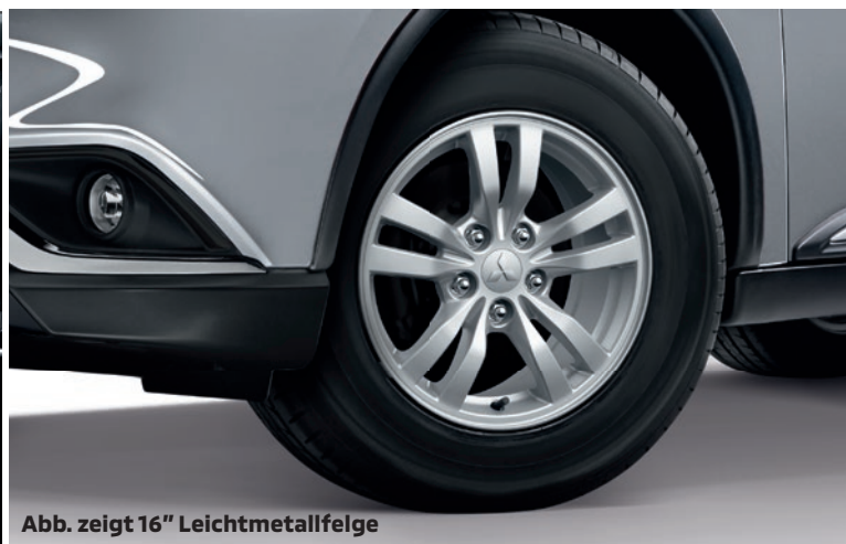
Abb. zeigt 16" Leichtmetallfelge