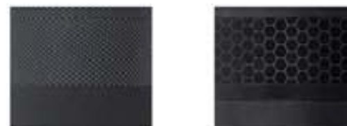
GRAUE Konsole Stoff „Casual“ GRAUE Konsole Stoff „Premium“