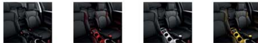
Tokyo BLACK Detroit RED London WHITE San Diego YELLOW