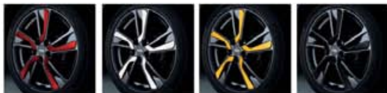
18-Zoll-Leichtmetallfelge mit Farbeinsätzen in Detroit Red, London White, San Diego Yellow, Tokyo Black*

*Bitte vereinbaren Sie nach drei Jahren eine Inspektion mit Ihrem Händler und erneuern Sie, wenn nötig, die Einsätze.