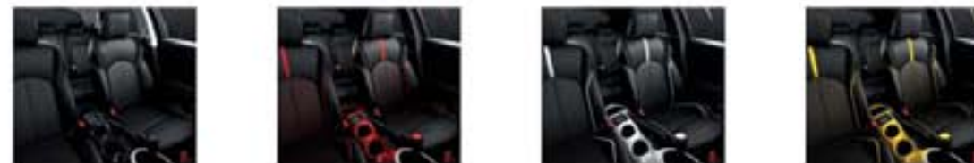
Tokyo BLACK Detroit RED London WHITE San Diego YELLOW