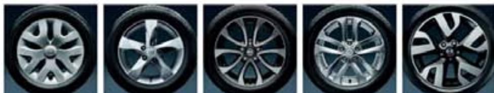
16-Zoll-Stahlfelge mit Radabdeckung 16-Zoll-Leichtmetallfelge „Casual“ 17-Zoll-Leichtmetallfelge „Shiro“ 17-Zoll-Leichtmetallfelge „Sport“ 18-Zoll-Leichtmetallfelge „n-tec“