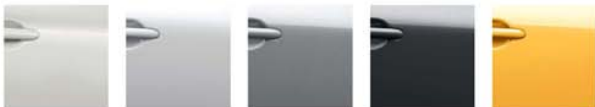
Pearl White – QAB Solid White – 326 Silver Grey – KY0 Dark Metallic Grey – KAD Sunlight Yellow – EAV