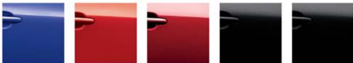
Ink Blue – RBN Solid Red – Z10 Force Red – NAH Night Shade – GAB Black Metallic – Z11