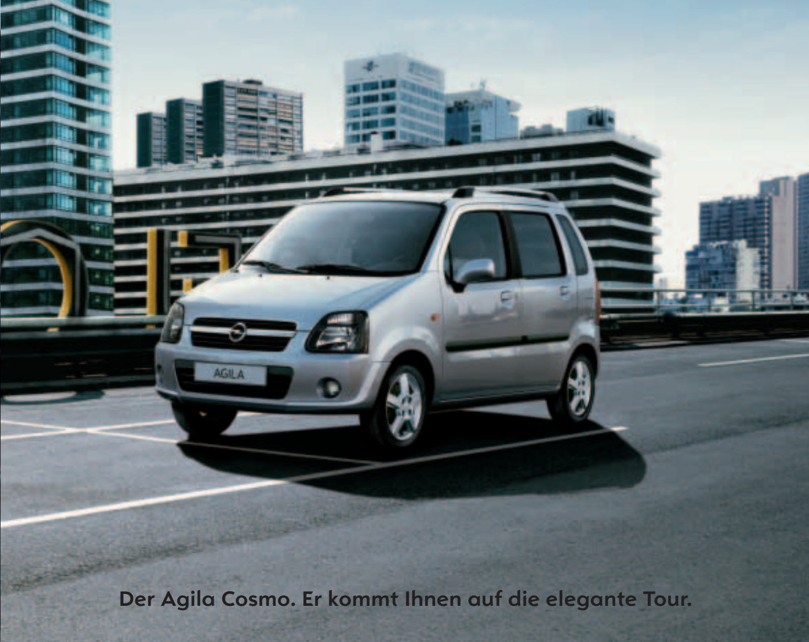
Der Agila Cosmo. Er kommt Ihnen auf die elegante Tour.