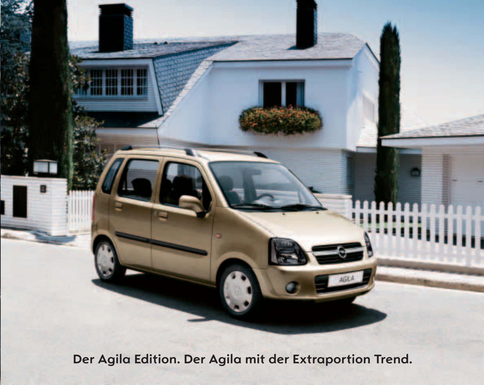
Der Agila Edition. Der Agila mit der Extraportion Trend.