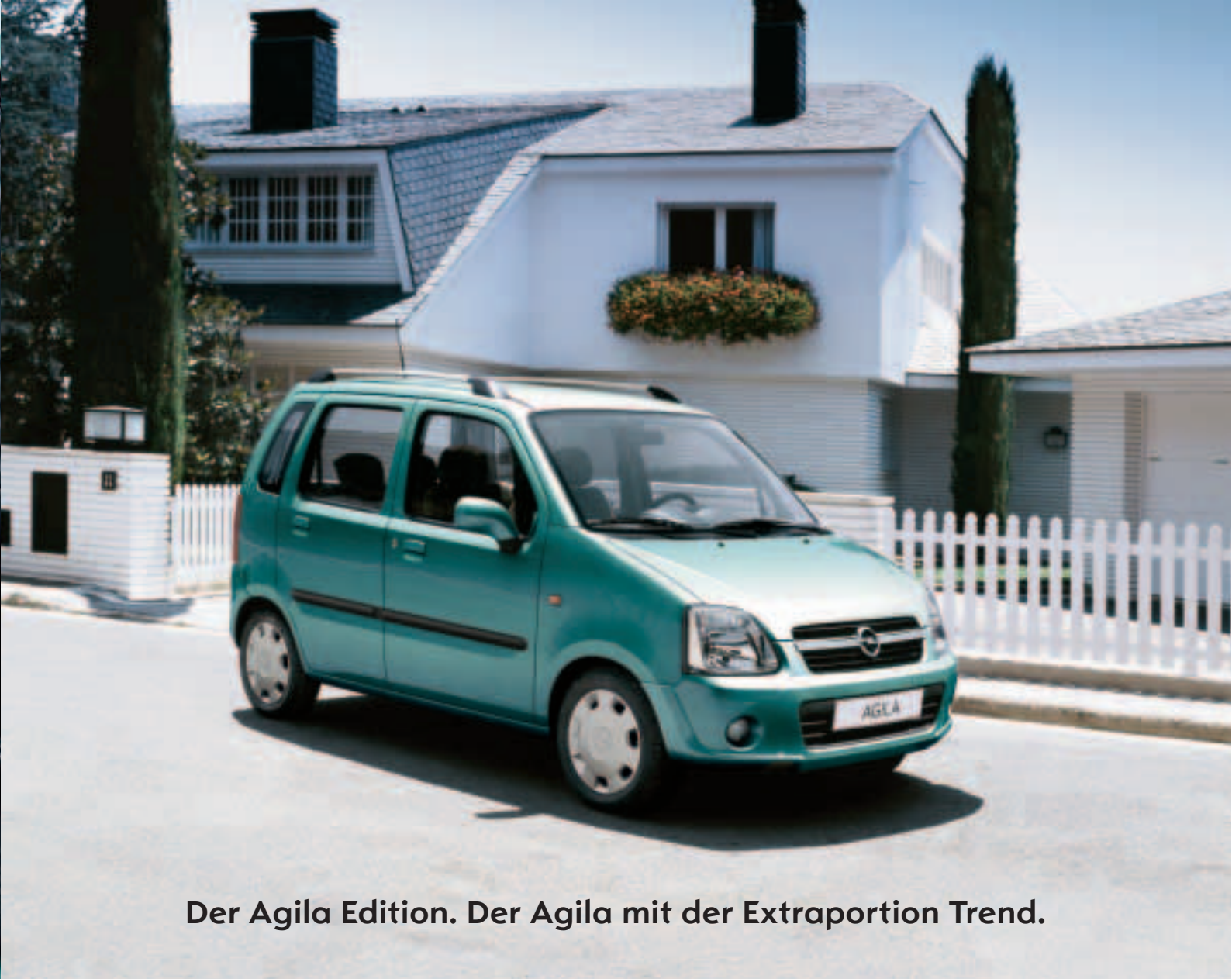
Der Agila Edition. Der Agila mit der Extraportion Trend.