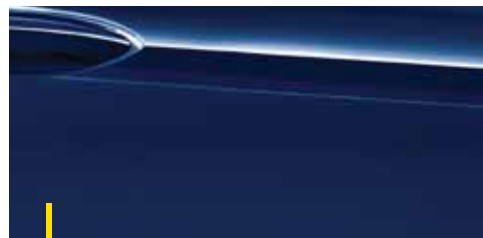
NAUTIC BLAU 2