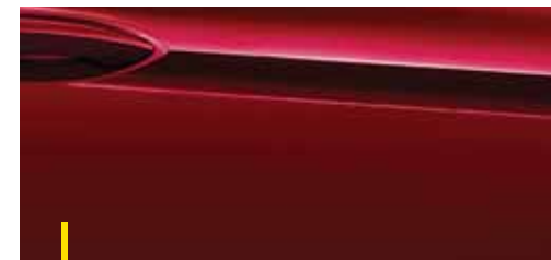
CHILI ROT 2