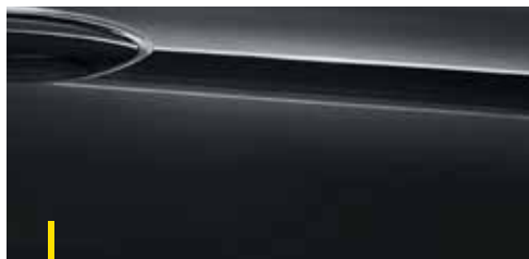
ONYX SCHWARZ 2