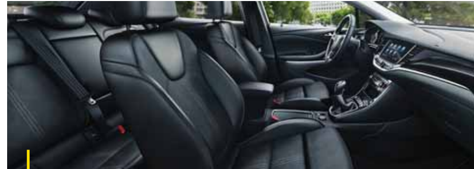
ALCANTARA Alcantara, Schwarz 2 .

Geben Sie dem Innenraum Ihres neuen Astra eine ganz persönliche Note.