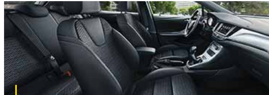
FORMULA Stoff Formula, Schwarz 2 .