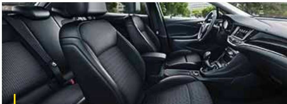
ELEGANCE Stoff Elegance/Premium-Lederoptik, Schwarz 2 .