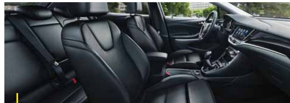
SIENA Leder, Schwarz 2 .