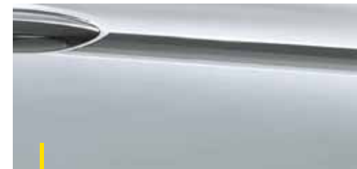
ARGON SILBER 2