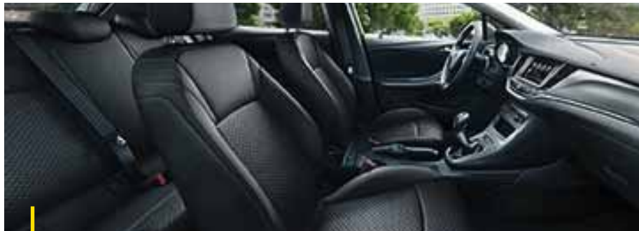
TALINO Stoff Talino, Schwarz.