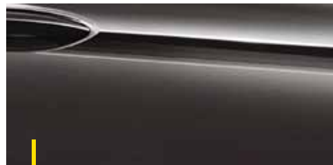
QUARZ GRAU 2