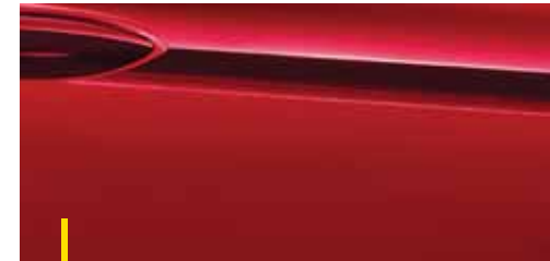
LAVA ROT 1