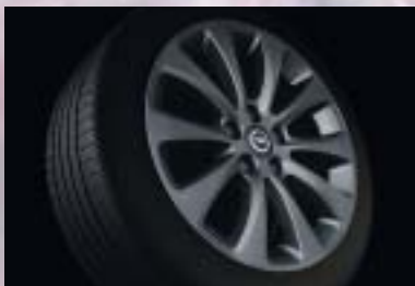
7 Leichtmetallrad, 6 1/2 J x 16 bzw. 7 J x 17, 10-Strahlenspeichen-Design, titanfarben, Reifen 205/55 R 16 bzw. 225/45 R 17