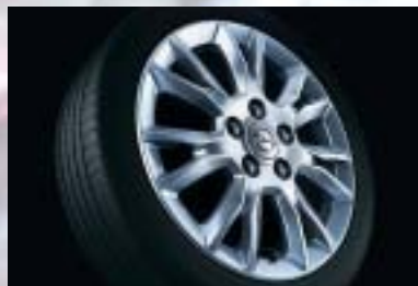
8 Leichtmetallrad, 6 1/2 J x 16, 7-Trapez-Speichen-Design, Reifen 205/55 R 16