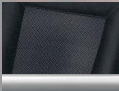
Twist/Elba, Anthrazit Dekorleiste: Mattchrom