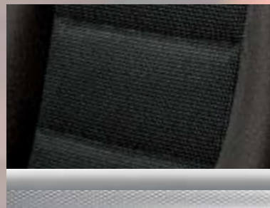
Alpha, Silber/Elba, Anthrazit Dekorleiste: Mattchrom (bei Edition „111 Jahre“) oder Chromquader (bei GTC Sport)