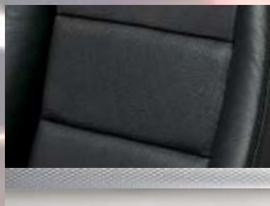
Leder, Anthrazit Dekorleiste: Mattchrom Seidenglanz (bei INNOVATION) oder Chromquader (bei GTC Sport)