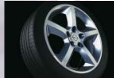
10 Leichtmetallrad, 7 J x 17, 5-Speichen-Design, Reifen 225/45 R 17