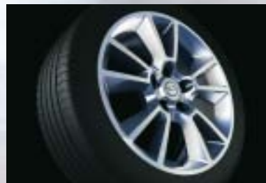
9 Leichtmetallrad, 7 J x 17, 5-Doppelspeichen-Design, Reifen 225/45 R 17