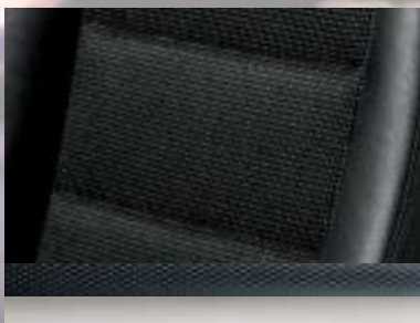
Alpha, Silber/Morrocana, Anthrazit Dekorleiste: Mattchrom Seidenglanz