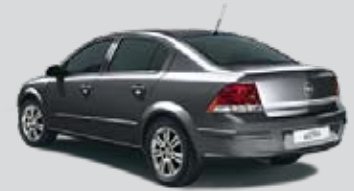
▲ Karbongrau 2