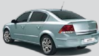
▲ Eisbergblau 3