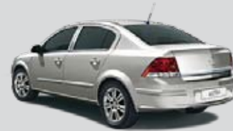
▲ Argonsilber 2