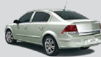
▲ Green Spirit 2