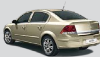
▲ Pannacotta 3