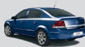
▲ Ultrablau 3