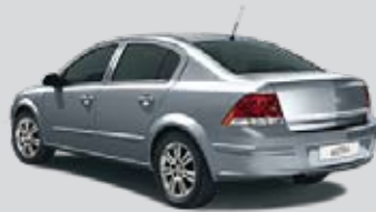
▲ Lichtsilber 2