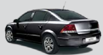
▲ Saphirschwarz 3