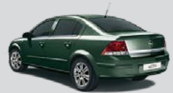
▲ Seegrasgrün 3