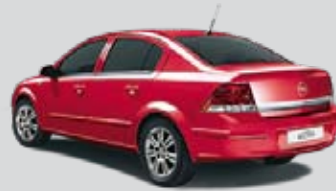
▲ Powerrot 1