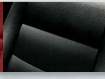
▲ Polster: Leder, Anthrazit Dekorleiste: Mattchrom Seidenglanz