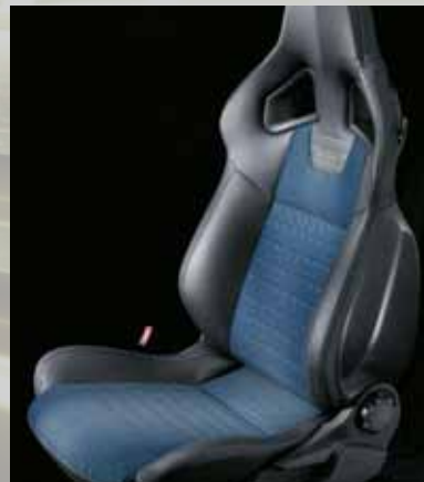
Splice, Blau/Morrocana 1 , Anthrazit