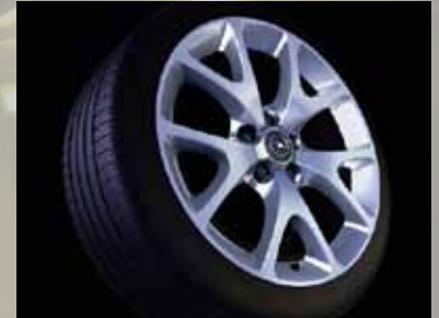
Leichtmetallrad 7½ J x 18 im 5-Speichen- OPC-Design, Reifen 225/35 R 18