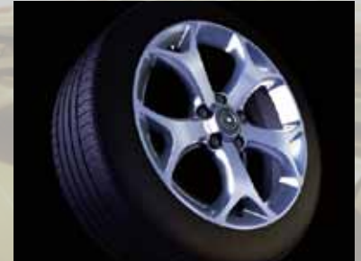
Leichtmetallrad 7 J x 17 im 5-Speichen- OPC-Design, Reifen 215/45 R 17