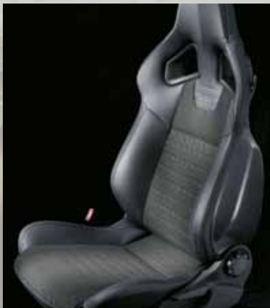
Splice, Silber/Morrocana 1 , Anthrazit