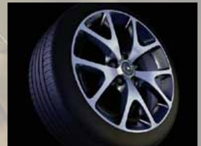
BiColor-Leichtmetallrad 7½ J x 18 im 5-Speichen-OPC-Design, Reifen 225/35 R 18