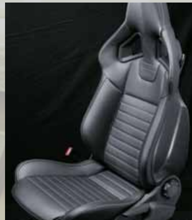
Leder 2 , Anthrazit

Kombinieren Sie sportliche Außenfarben und hochwertige Rennsitz-Optik: Wählen Sie Ihre individuelle Kombination.