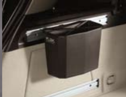
FlexOrganizer® Service-Box. Ideal z. B. für Autopflege-Zubehör und Scheibenwaschmittel.