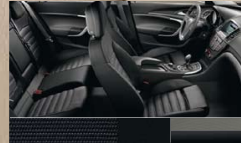
Vitesse/Atlantis, Schwarz Dekorleisten: Titaniumdesign, Klavierlack Schwarz