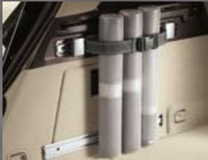
FlexOrganizer® Befestigungsgurte. Vielfache Einsatzmöglichkeiten durch stufenlose Einstellung.