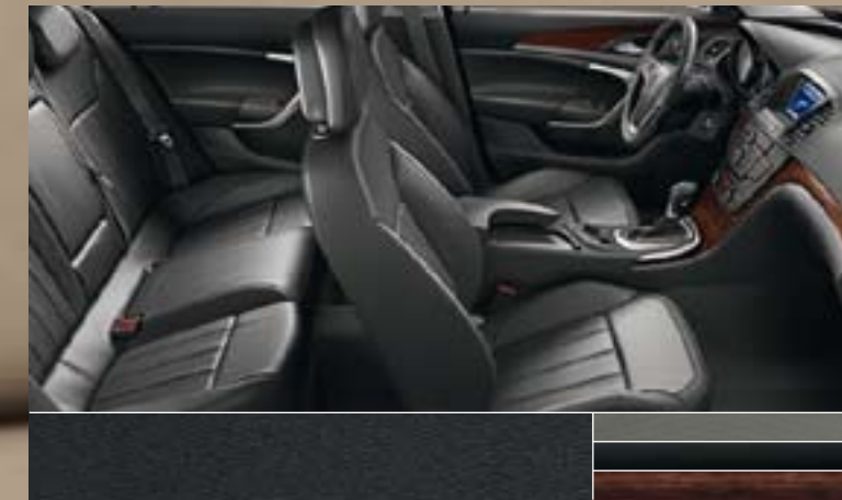
Leder Siena, Schwarz Dekorleisten: Titaniumdesign, Klavierlack Schwarz, Kibo-Holzdesign