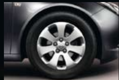
3 Leichtmetallrad 7 J x 17 im 7-Speichen-Design, Reifen 225/55 R 17 (Q00).