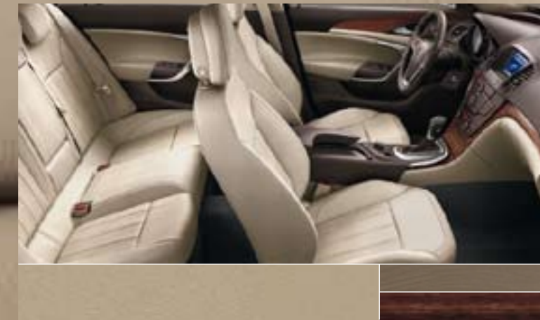
Leder Siena, Beige Dekorleisten: Titaniumdesign Oliv, Kibo-Holzdesign