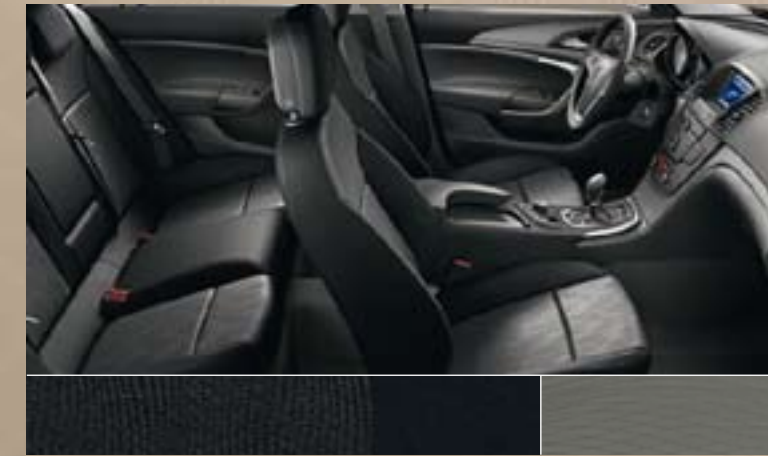
Dune/Atlantis, Schwarz Dekorleiste: Titaniumdesign