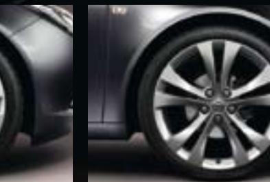
8 Leichtmetallrad 8 1/2 J x 20 im 5-Doppelspeichen-Stern-Design, Reifen 245/35 R 20 (Q9U).