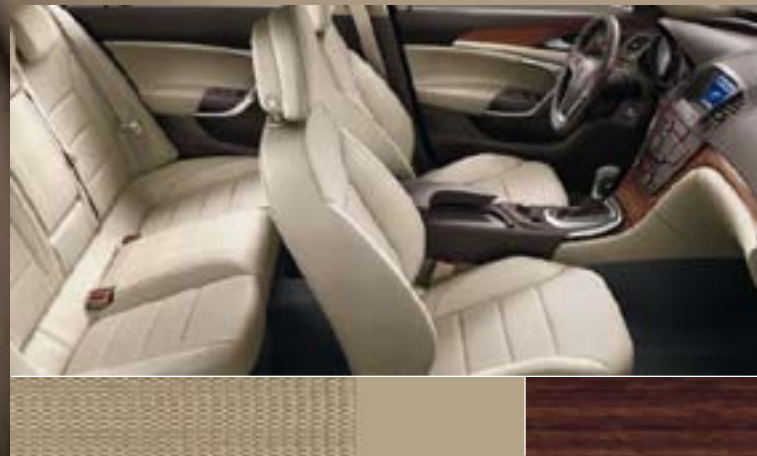
Avenue/Morrocana, Beige Dekorleiste: Kibo-Holzdesign