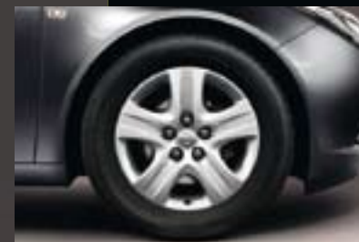
2 Designrad 7 J x 17, Reifen 225/55 R 17 (QR8).