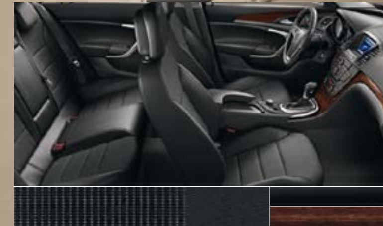
Avenue/Morrocana, Schwarz Dekorleisten: Klavierlack Schwarz, Kibo-Holzdesign