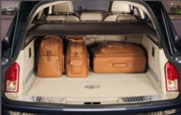
Gepäckraum. Mit einem Volumen von 540 l bietet der Gepäckraum des neuen Opel Insignia Sports Tourer reichlich Freiraum für Beruf und Freizeit.