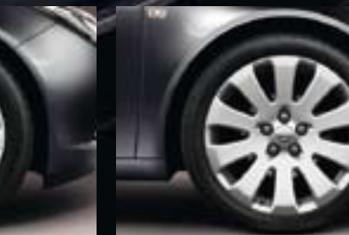
7 Leichtmetallrad 8 1/2 J x 19 im 10-Speichen-Design, Reifen 245/40 R 19 (Q9S).