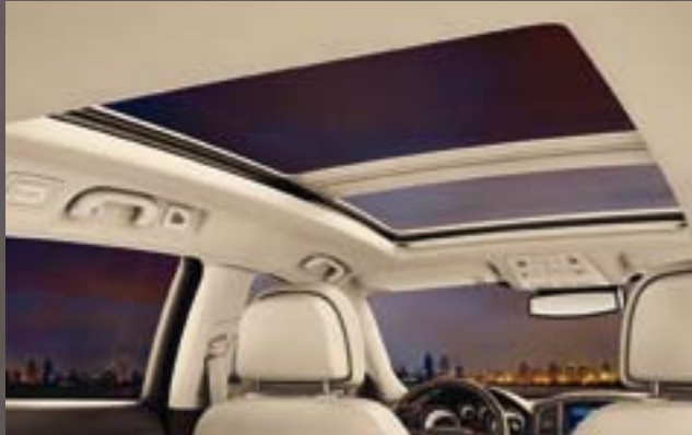
Panorama-Schiebedach. Das Panorama-Schiebedach des neuen Opel Insignia Sports Tourer erstreckt sich nahezu über die gesamte Dachlänge, das elektrische Rollo schützt gegen starke Sonneneinstrahlung.