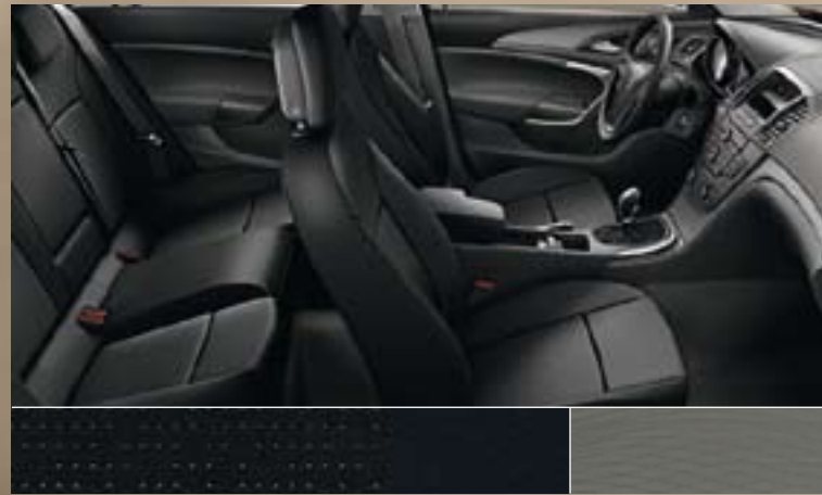
Labyrinth/Atlantis, Schwarz Dekorleiste: Titaniumdesign