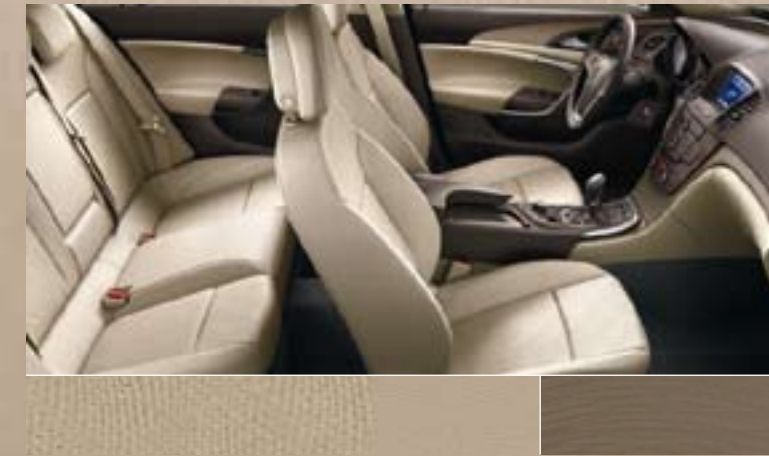
Dune/Atlantis, Beige Dekorleiste: Titaniumdesign Oliv