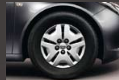
1 Stahlrad 6 1/2 J x 16 inkl. Abdeckung, Reifen 215/60 R 16 (QB5).

• = Serie ○ = Option - = nicht verfügbar 1 Nicht für Sports Tourer in Verbindung mit Adaptivem 4x4 Allradantrieb. 2 Nicht in Verbindung mit 1.6 ECOTECH. 3 Serie für Sports Tourer in Verbindung mit Adaptivem 4x4 Allradantrieb.