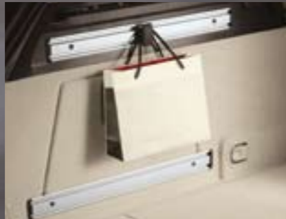
FlexOrganizer® Befestigungshaken. Für Fixierung z. B. von Einkaufstüten in senkrechter Position.

Erweiterte Möglichkeiten. Mit Opel Original Zubehör machen Sie noch mehr aus Ihrem Opel Insignia.