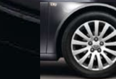
5 Leichtmetallrad 8 J x 18 im 13-Speichen-Design, Reifen 245/45 R 18 (Q56).