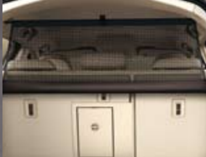
Sicherheitsnetz. Flexible Trennung von Fahrgast- und Gepäckraum zum Schutz der Insassen. Verfügbar in Jet Black oder Titanium.