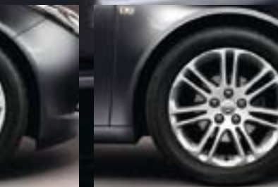
6 Leichtmetallrad 8 J x 18 im 7-Doppelspeichen-Sport-Design, Reifen 245/45 R 18 (Q60).