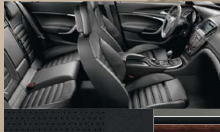
Leder Siena, Schwarz (perforiert) Dekorleisten: Titaniumdesign, Klavierlack Schwarz, Kibo-Holzdesign