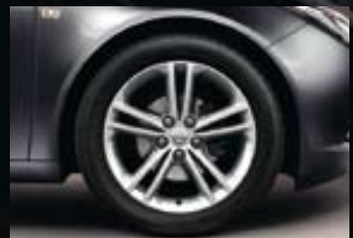
4 Leichtmetallrad 8 J x 18 im 5-Doppelspeichen-Sport-Design, Reifen 245/45 R 18 (Q02).