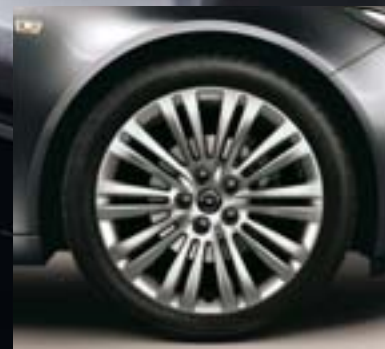
6 Leichtmetallrad 8 J x 18 im 10-Doppelspeichen-Design, Reifen 245/45 R 18 (RT4).