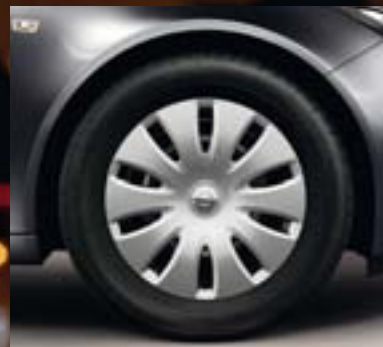
② Stahlrad 7 J x 17 inkl. Abdeckung im 10-Speichen-Design, Reifen 225/55 R 17 (Q84).