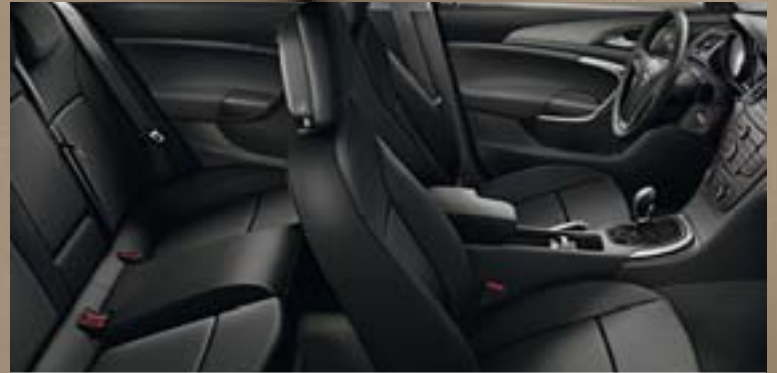
Stoff Labyrinth/Atlantis, Schwarz Dekorleiste: Titaniumdesign