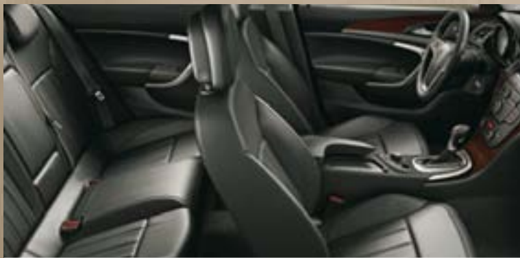
Leder Siena¹, Schwarz Dekorleisten: Titaniumdesign, Klavierlack Schwarz, Kibo-Holzdesign