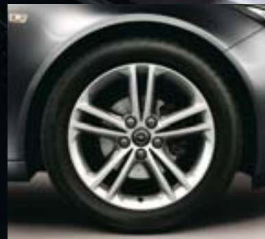
5 Leichtmetallrad 8 J x 18 im 5-Doppelspeichen-Sport-Design, Reifen 245/45 R 18 (Q02).