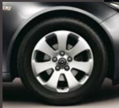
4 Leichtmetallrad 7 J x 17 im 7-Speichen-Design, Reifen 225/55 R 17 (Q00).