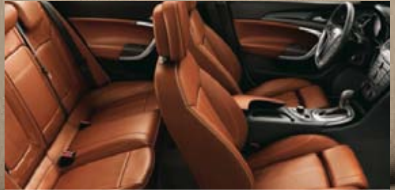
Premium-Nappaleder, Indian Summer Dekorleiste: Klavierlack Schwarz