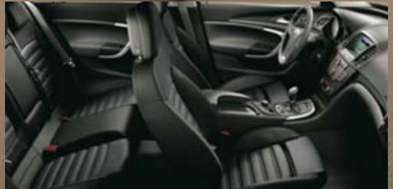
Stoff Ribbon, Schwarz mit weißen Nähten Dekorleisten: Titaniumdesign, Klavierlack Schwarz