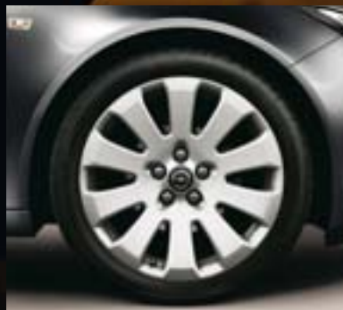
⑨ Leichtmetallrad 8½ J x 19 im 10-Speichen-Design, Reifen 245/40 R 19 (Q9S).