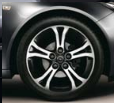
⑦ Leichtmetallrad 8 J x 18 im 5-Doppelspeichen-Design, BiColor, Reifen 245/45 R 18 (Q7B).