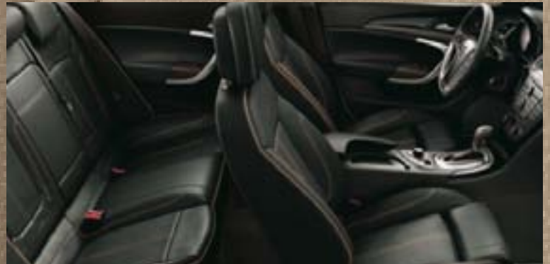
Premium-Nappaleder, Indian Night, Schwarz mit Ziernähten in Indian Summer. Dekorleiste: Klavierlack Schwarz