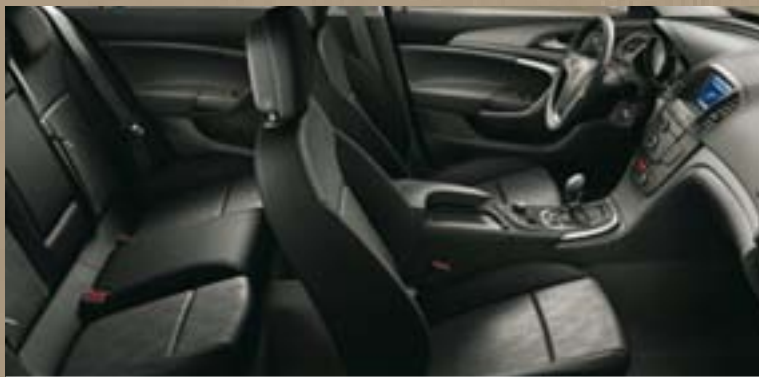
Stoff Dune/Atlantis, Schwarz Dekorleiste: Titaniumdesign