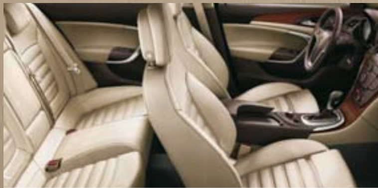
Leder Siena¹, Beige (perforiert) Dekorleisten: Titaniumdesign Oliv, Kibo-Holzdesign