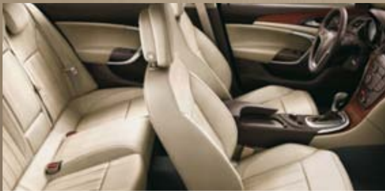
Leder Siena¹, Beige Dekorleisten: Titaniumdesign Oliv, Kibo-Holzdesign