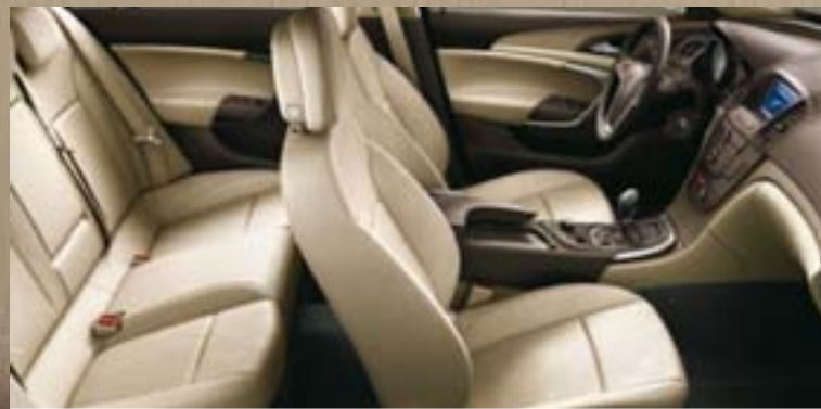
Stoff Dune/Atlantis, Beige Dekorleiste: Titaniumdesign Oliv