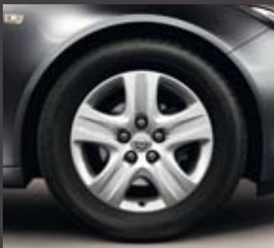
3 Designrad 7 J x 17, Reifen 225/55 R 17 (QR8).

3 Nicht für Sports Tourer in Verbindung mit Adaptivem 4x4 Allradantrieb.