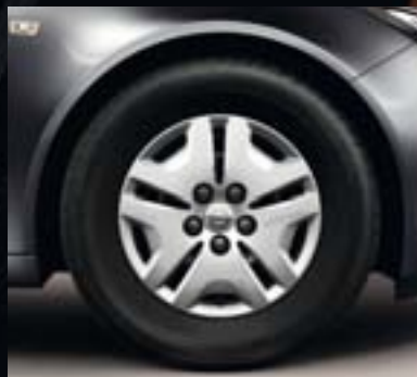
① Stahlrad 6½ J x 16 inkl. Abdeckung, Reifen 215/60 R 16 (Q85).