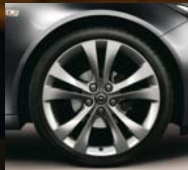
⑩ Leichtmetallrad 8½ J x 20 im 5-Doppelspeichen-Stern-Design, Reifen 245/35 R 20 (Q9U).