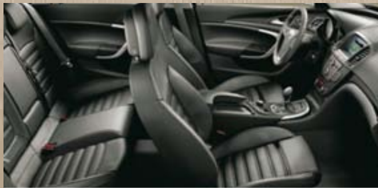
Leder Siena¹, Schwarz (perforiert) Dekorleisten: Titaniumdesign, Klavierlack Schwarz, Kibo-Holzdesign