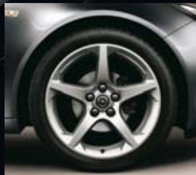
⑧ Leichtmetallrad 8½ J x 19 im 5-Speichen-Design, Reifen 245/40 R 19 (Q93).