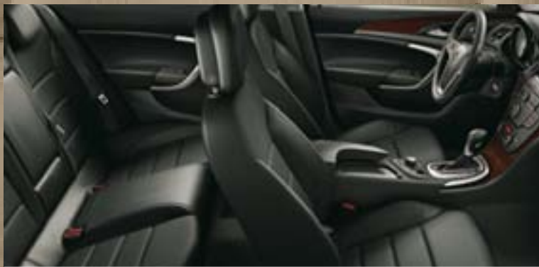
Stoff Ribbon/Morrocana 1 , Schwarz Dekorleisten: Klavierlack Schwarz, Kibo-Holzdesign