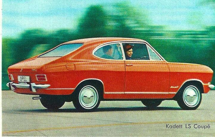
Kadett LS Coupé