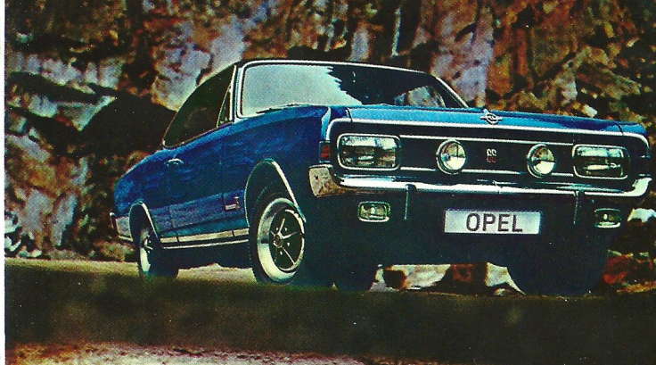
Commodore GS Coupé