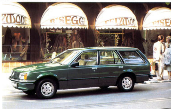
Rekord Caravan Berlina