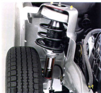
Federbeinachse vorn nach dem McPherson-Prinzip.

Daß die Sportlichkeit nicht auf Kosten des Fahrkomforts gehen muß, stellt der neue Ascona überzeugend unter Beweis. Sein hervorragend abgestimmtes Fahrwerk mit Federbein-