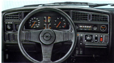
Instrumententafel Ascona SR. Radio ist Sonderausstattung.

hohen Wirkungsgrad und damit zu mehr Wirtschaftlichkeit führt. Serienmäßig: der 1.3 S-Motor mit 55 kW (75 PS) oder wahlweise der 1.3 N-Motor mit 44 kW (60 PS). Gegen Mehrpreis : der 1.6 N-Motor mit 55 kW (75 PS) und der