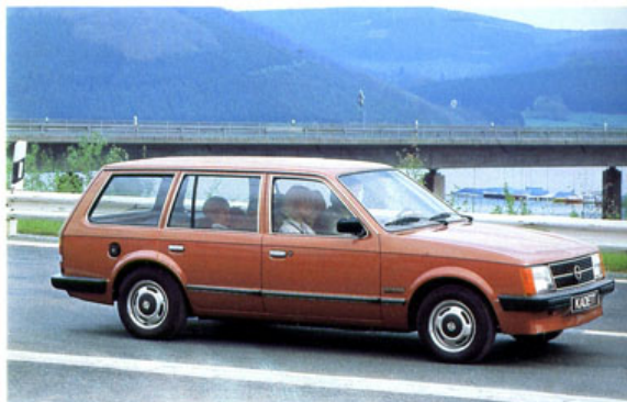
Kadett Voyage Berlina. Metallic-Lackierung ist Sonderausstattung.

Die Kunst, das Nützliche mit dem Angenehmen zu verbinden. Er stellt die wirtschaftliche Kombination von Nutzraum, 6-Zylinder-Laufruhe, Leistung und reichhaltigem Ausstattungs-komfort dar. Zwei Motoren stehen zur Wahl: der serienmäßige 2.5 S und – auf Wunsch, gegen Mehrpreis – das 2.5 E-Triebwerk.