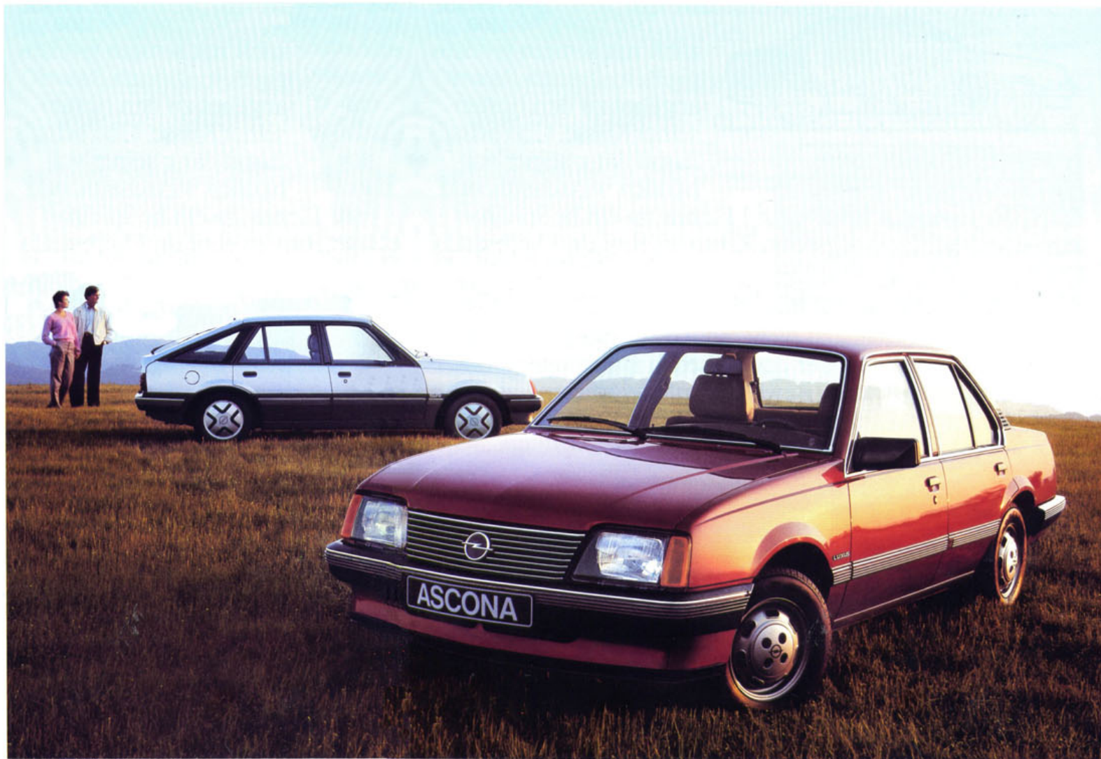
Ascona Luxus, 4türig, und Ascona SR, 5türig.

Opel hat die Initiative ergriffen – und mit dem neuen Ascona ein Fahrzeug-Konzept verwirklicht, das ein neues Verhältnis schafft zwischen Leistung und Wirtschaftlichkeit, Raumangebot und Verbrauch, Sportlichkeit und Fahrkomfort. So ist der neue Opel Ascona – als klassische Stufenheck-Limousine und als 5türige Fließheck-Version –