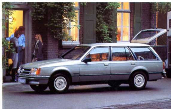
Commodore Voyage Berlina. Leichtmetallfelgen, Metallic-Lack. Sonderausstattung.

Kadett Voyage. 3 Modelle. 3 Motoren: 1.3 N mit 44 kW (60 PS). Gegen Mehrpreis 1.3 S-OHC mit 55 kW (75 PS) oder 1.6 S-OHC mit 66 kW (90 PS). 3- und 5türig in besonders reichhaltiger Luxusausstattung. 5türig in komfortabler Berlina-Ausstattung. Rekord Caravan. 4 Modelle. 5 Motoren: vom serienmäßigen 1.9 N mit 55 kW (75 PS) über – gegen Mehrpreis – den 2.0 N mit 66 kW (90 PS), den 2.0 S mit 74 kW (100 PS) und den 2.0 E mit 81 kW (110 PS) bis zum 2.3 D mit 48 kW (65 PS). 3- oder 5türig in Grund-, 5türig in Luxus- und Berlina-Ausstattung. Commodore Voyage. 2 Modelle. 2 Motoren: 2.5 S-Motor mit 85 kW (115 PS) und – gegen Mehrpreis – 2.5 E-Motor mit 96 kW (130 PS).