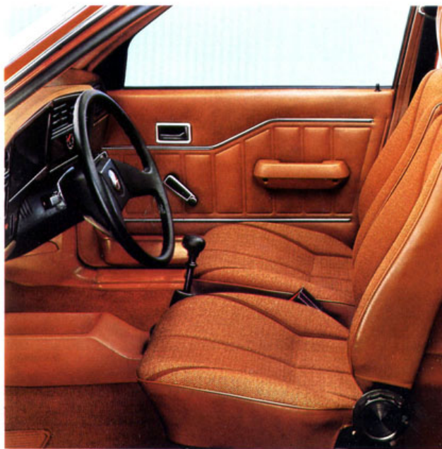
Ascona Luxus, 4-türig

achse vorn nach dem McPherson-Prinzip und Verbundlenker-Hinteradaufhängung mit Miniblockfedern gibt ihm seine vorbildliche Straßenlage und hohen Federungskomfort. Sein