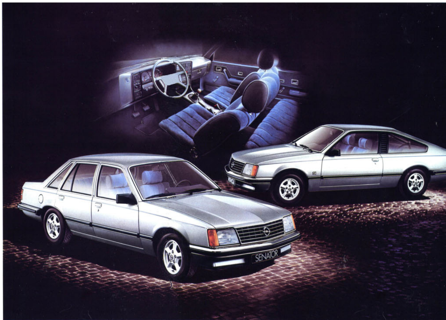
Senator C, Monza C.

und erbringt damit ausgezeichnete Leistungswerte bei sparsamem Verbrauch. Senator und Monza sind technologisch beispielhafte Automobile der Spitzenklasse, die mit ihrem ausgewogenen Fahrkomfort, ihrer extremen