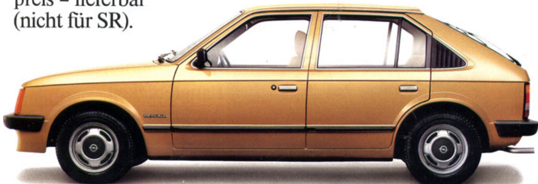
Kadett Berlina, 5türig

Die Opel-Automatic ist ab sofort in Verbindung mit den 1.3 N-, 1.3 S- und 1.6 S-Motoren – auf Wunsch, gegen Mehrpreis – lieferbar (nicht für SR).