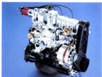
Der neue 1.6 S-OHC-Motor.

Motoren dem neuen Ascona Leistungsreserven und Temperament, der 1.6 S-OHC-Motor auch dem Kadett eine besonders sportliche Kondition.