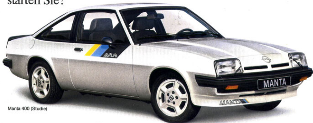
Manta 400 (Studie)