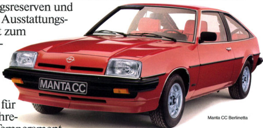
Manta CC Berlinetta

Manta und Manta CC. Zwei Modell-Varianten, die sportliche Kondition zu wirtschaftlicher Kondition bieten. Wann starten Sie?