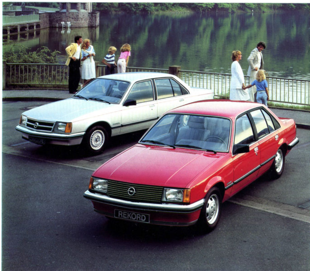
Rekord Luxus. Commodore Berlina (Leichtmetallfelgen und Metallic-Lackierung sind Sonderausstattungen).

Raumangebot, Komfort, Laufruhe, Sicherheit und Leistung zeichnen Rekord und Commodore aus. Sie sind Automobile, die bei allem Anspruch auch der berechtigten