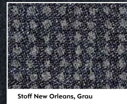
Stoff New Orleans, Grau