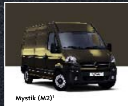
Mystik (M2) 1