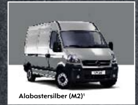
Alabastersilber (M2) 1