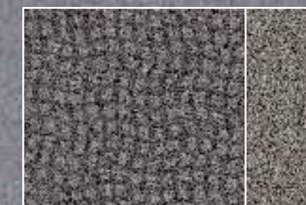
Muscade, grau 5 (Vinyl)