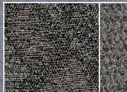
Gateway, grau (Stoff)