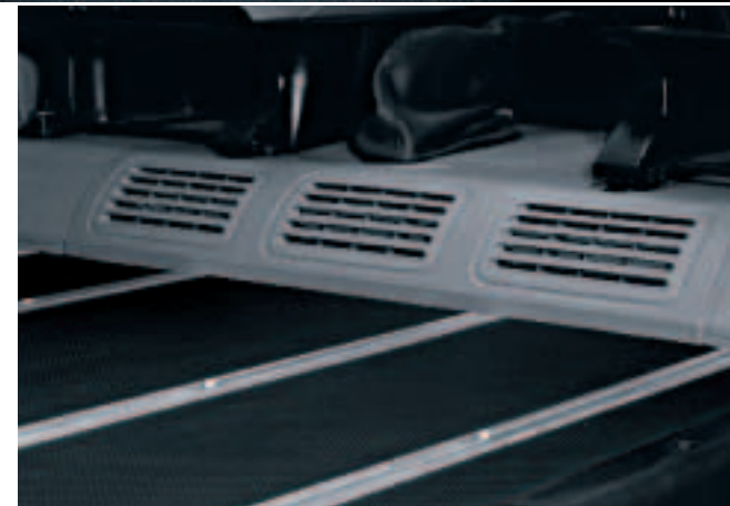
Warme Füße für alle: Drei Luftauslassdüsen sind am Boden vor den Einzelsitzen im Fond platziert.

Life überzeugende Argumente: u. a. die günstigste Kaskoeinstufung, niedrigen Kraftstoffverbrauch, niedrige Steuern und lange Serviceintervalle von 30.000 km, dazu 12 Jahre Garantie gegen Durchrostung. Und natürlich die Auswahl zwischen drei leistungs- und drehmomentstarken Common Rail Dieselmotoren und einem spritzigen 2.0 Benziner. Alle Aggregate überzeugen mit kultivierter Laufruhe, sodass Sie sich wie in einer Mittelklasse-Limousine fühlen können.