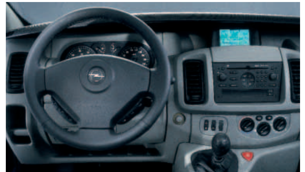
Sportlich und komfortabel: So macht Steuern noch mehr Spaß. Das edle Lederlenkrad sieht nicht nur gut aus, es liegt auch optimal in der Hand.

Darüber hinaus glänzt er mit der edlen Optik seines Lederlenkrads und dem hohen Komfort einer Klimaanlage vorn und hinten. Aber der Vivaro Life Edition überzeugt nicht nur durch mehr Komfort und sein ansprechendes Design – er ist auch eine clevere Alternative. Schließlich bietet er eine ganze Reihe außergewöhnlicher Features serienmäßig, die sonst nur als Sonderausstattung lieferbar sind.