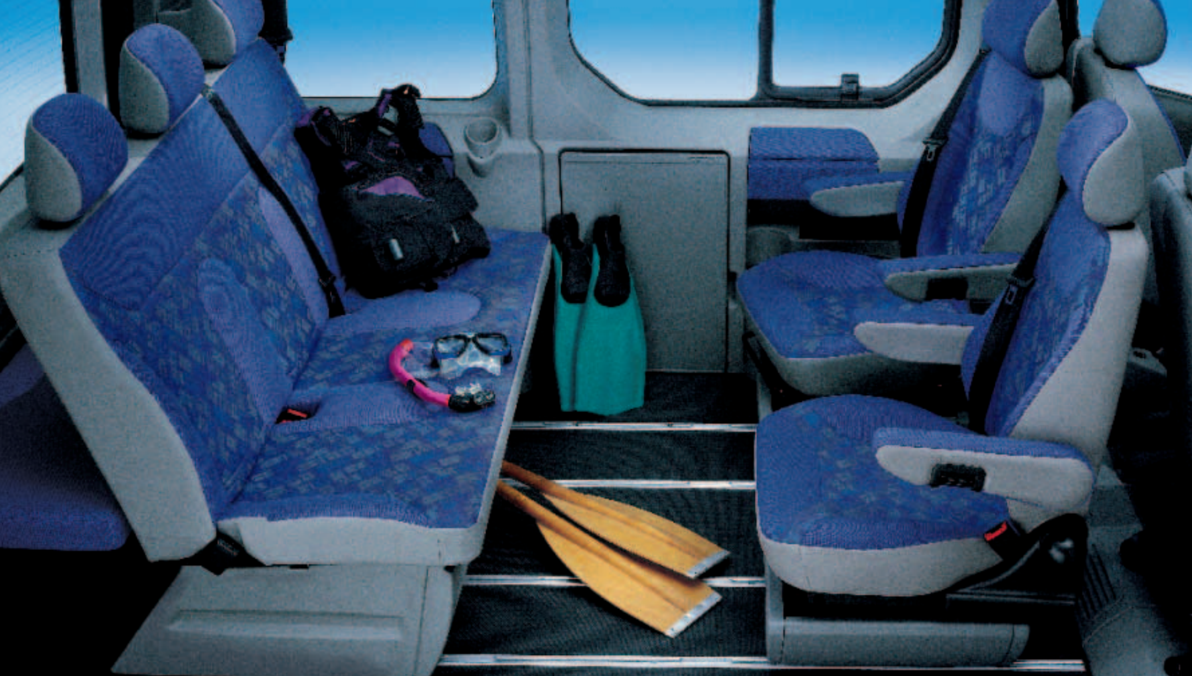
Funktional bis ins Detail: Die Rückbank dient gleichzeitig als Liegeflächenverlängerung (Kopfauflege in Liegeposition). Der Kofferraumteiler hinter der Sitzbank ist hochklappbar bzw. ausbaubar und bietet eine Durchreiche z. B. für Skier oder Snowboards.