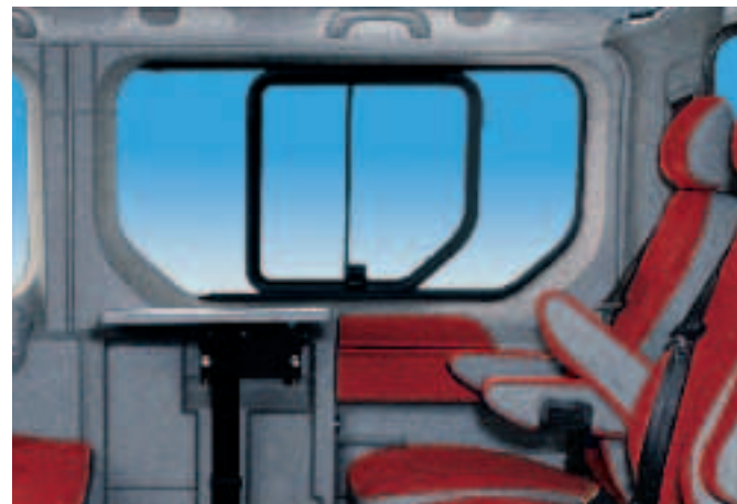
Frischer Wind im Fond: Die Seitenfenster rechts und links neben der 2. Sitzreihe lassen sich zum Öffnen verschieben.

puterspiele-Spaß. Größere Kinder und Erwachsene profitieren im Falle eines Falles von 3-Punkt-Sicherheitsgurten und höhenverstellbaren Kopfstützen auf allen Plätzen sowie pyrotechnischen Gurtstraffern mit Gurtkraftbegrenzern (vorn und auf den äußeren Plätzen der Sitzbank). Gute Fahrt!