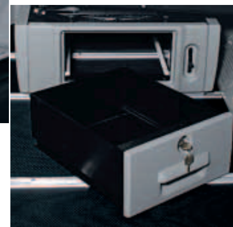
Verschlussache: In der Konsole des Einzelsitzes hinter dem Fahrersitz ist ein Wertfach mit Schloss integriert.