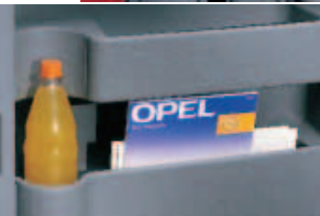
Erfrischende Unterhaltung: Neben dem Einzelsitz auf der Fahrerseite befinden sich zwei offene Ablagefächer für 1,5-l-PET-Flaschen sowie ein Zeitschriftenfach.