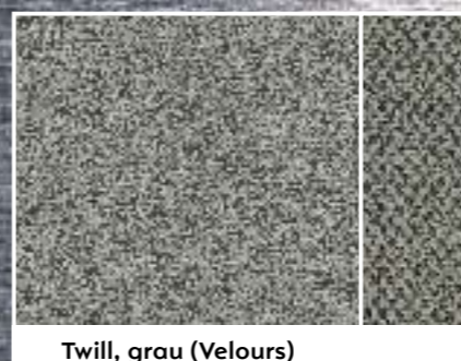
Twill, grau (Velours)