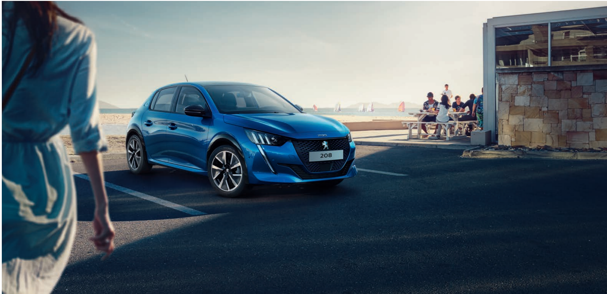
DER NEUE PEUGEOT e-208 GT