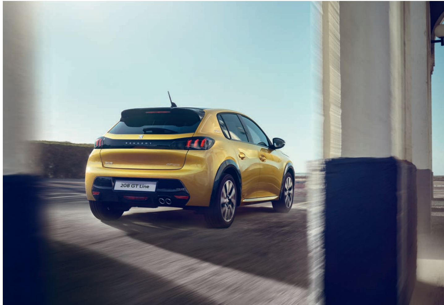
DER NEUE PEUGEOT 208 GT-LINE