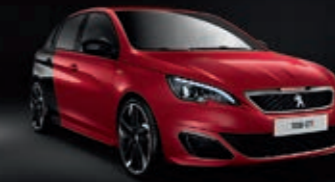
Ultimate Rot/Perla Nera Schwarz