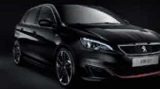
Perla Nera Schwarz