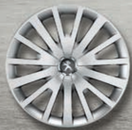
Radzierblende 15" AMBRE