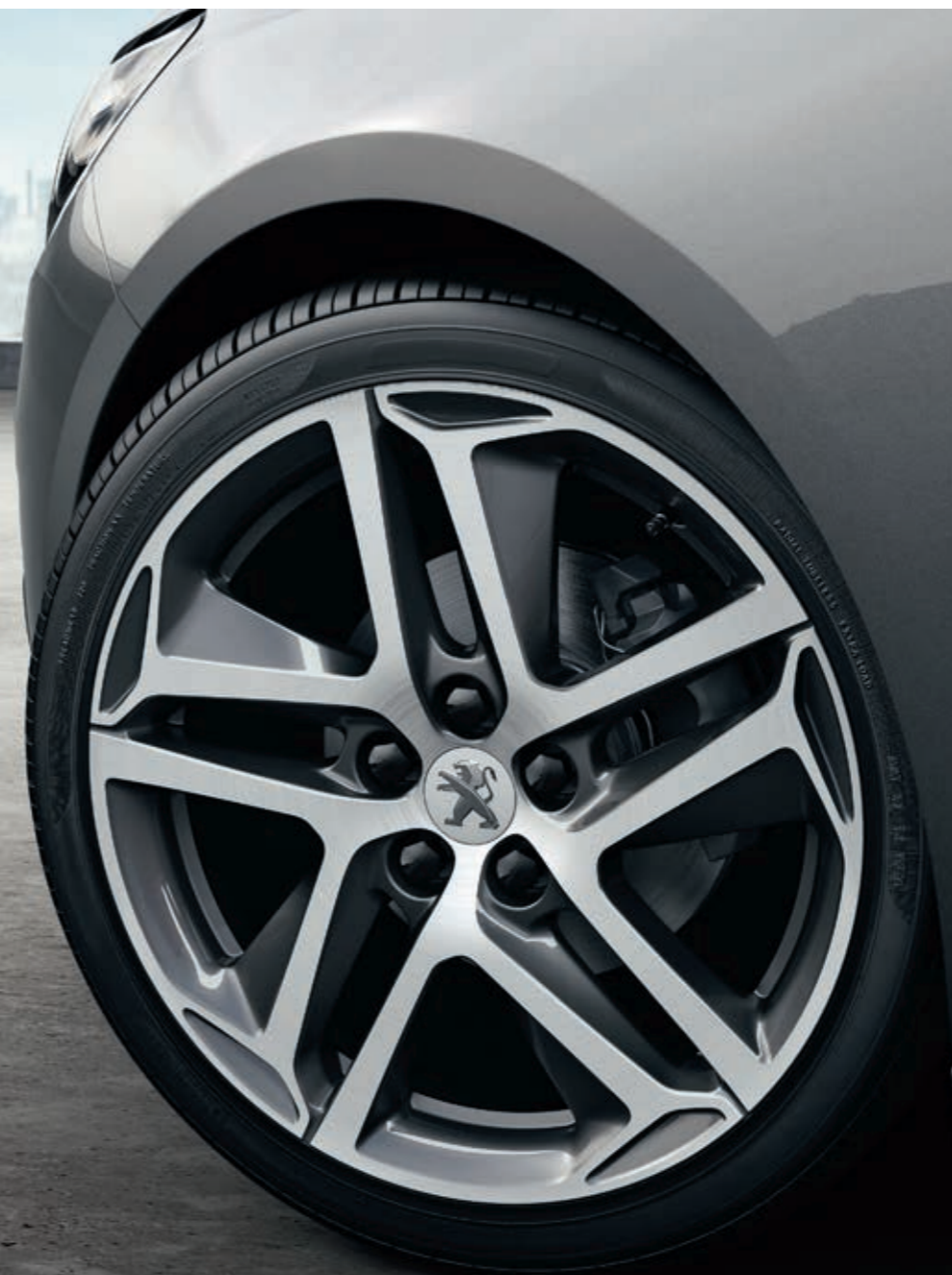
Leichtmetallfelge 18" SAPHIR zweifarbig

* Auch i. V. m. GT-Line-Paket erhältlich. ** Nur i. V. m. GT-Line-Paket erhältlich.