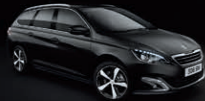
Perla Nera Schwarz*