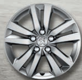
Leichtmetallfelge 16" QUARTZ