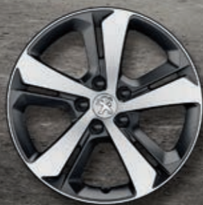
Leichtmetallfelge 17" RUBIS* zweifarbig