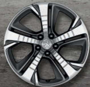
Leichtmetallfelge 18" DIAMANT** zweifarbig