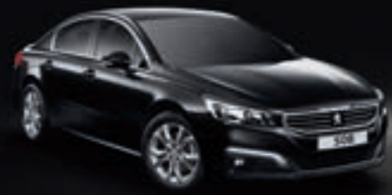
Perla Nera Schwarz