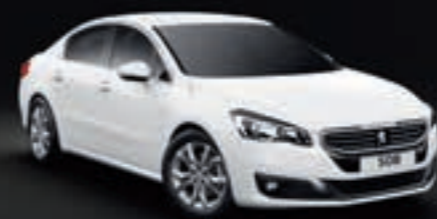
PERLEFFEKTLACKIERUNG – Perlmutter Weiß