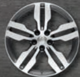
Leichtmetallfelgen 18" Archipel***