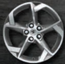
Leichtmetallfelgen 17" Style 11