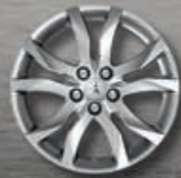
Leichtmetallfelgen 17" Style 05