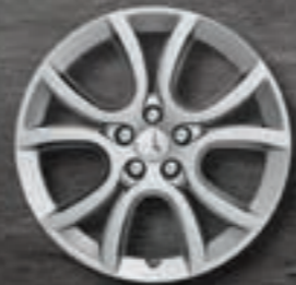
Leichtmetallfelgen 18" Style 07