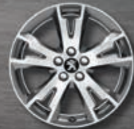
Leichtmetallfelgen 18" Grand Angle**