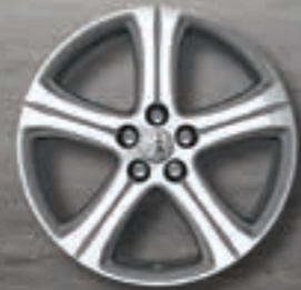
Leichtmetallfelgen 18" Style 10