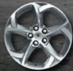
Leichtmetallfelgen 17" Style 06