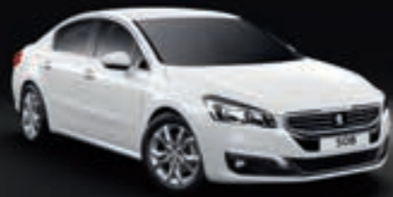
UNILACKIERUNG – Schneeweiß