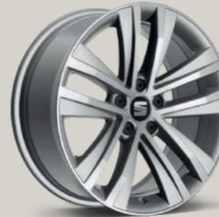
AKIRA St XC