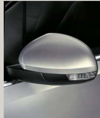
REFLEX SILBER 2