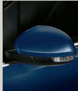
ATLANTIC BLAU 2