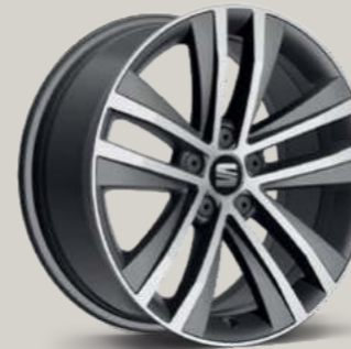
AKIRA ATOM GRAU FR