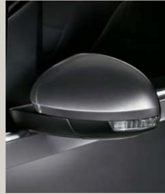
INDIUM GRAU 2