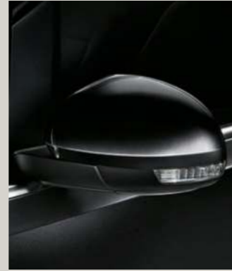
DEEP SCHWARZ 2