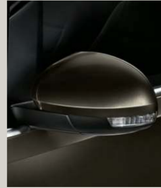
OAK BRAUN 2