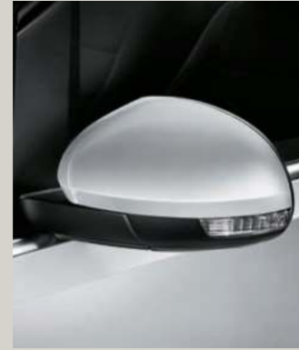
WHITE SILBER 2