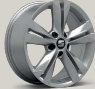
DYNAMIC II XC