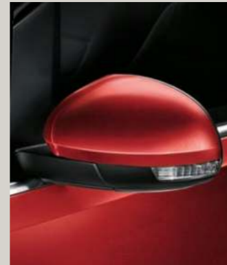
ROMANCE ROT 2