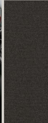
MIKELLY STOFF SCHWARZ