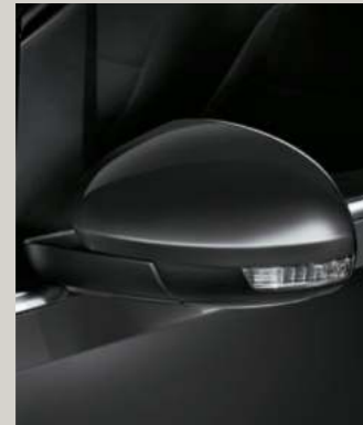
URANO GRAU 1