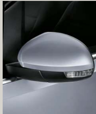
MOONSTONE SILBER 2