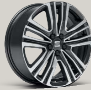
DYNAMIC 20/2 OBERFLÄCHE GLANZGEDREHT