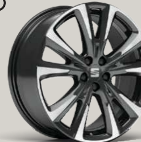
PERFORMANCE NUCLEAR GRAU OBERFLÄCHE GLANZGEDREHT