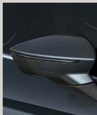
MAGNETIC GRAU 2