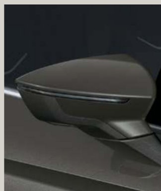
CLIFF GRAU 3