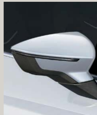
NEVADA WEISS 2