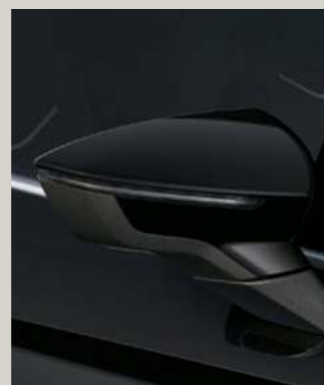
MIDNIGHT SCHWARZ 2