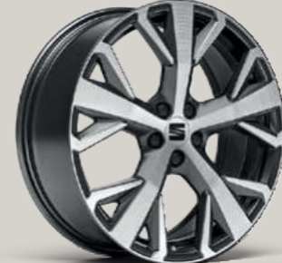
PERFORMANCE 20/3 GRAU OBERFLÄCHE GLANZGEDREHT