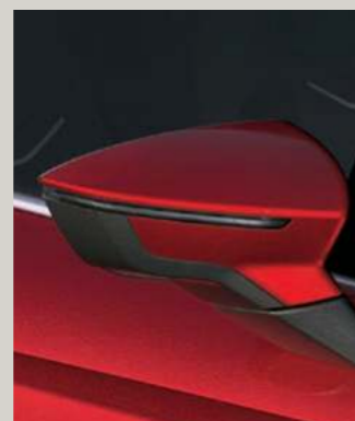
DESIRE ROT 3