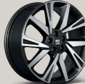
MACHINED SPORT BLACK COSMO GRAU OBERFLÄCHE GLANZGEDREHT