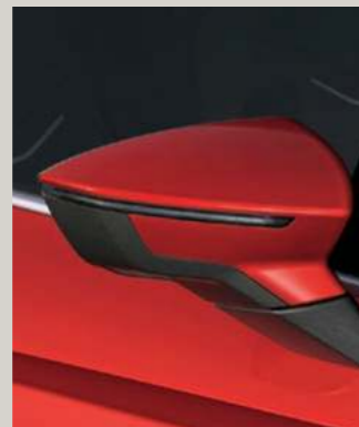
PURE ROT 1