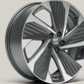
PERFORMANCE 20/4 COSMO GRAU MATT, OBERFLÄCHE GLANZGEDREHT