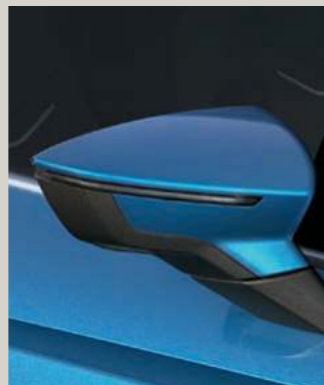
SAPPHIRE BLAU 2