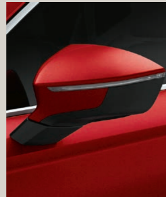
VELVET ROT 3 St XP FR