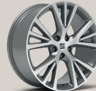
EXCLUSIVE IV IN ATOM GRAU, GLANZGEDREHT