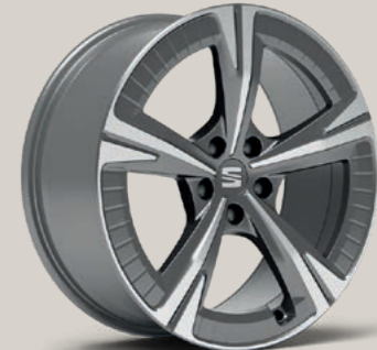
EXCLUSIVE V IN ATOM GRAU, GLANZGEDREHT