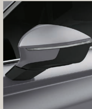
REFLEX SILBER 2 R St XP