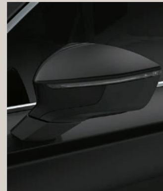
MAGIC SCHWARZ 2 R St XP FR