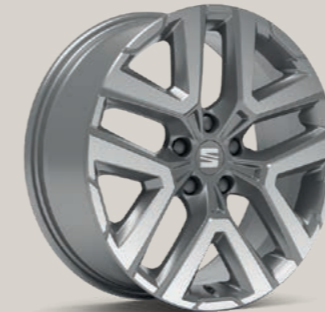
PERFORMANCE V IN ATOM GRAU, GLANZGEDREHT