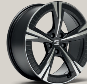
EXCLUSIVE V IN COSMO GRAU, GLANZGEDREHT