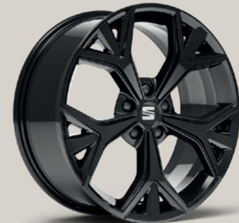
EXCLUSIVE IX IN SCHWARZ, GLANZGEDREHT