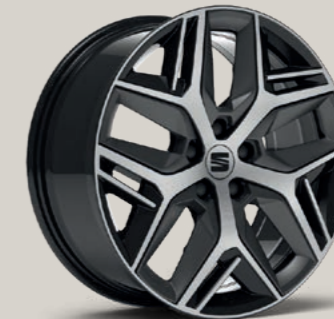
EXCLUSIVE VI IN COSMO GRAU, GLANZGEDREHT