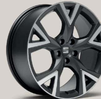
EXCLUSIVE VII IN COSMO GRAU, GLANZGEDREHT