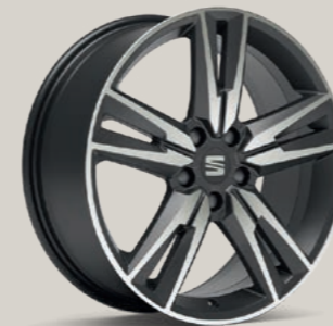
PERFORMANCE IV IN COSMO GRAU, GLANZGEDREHT