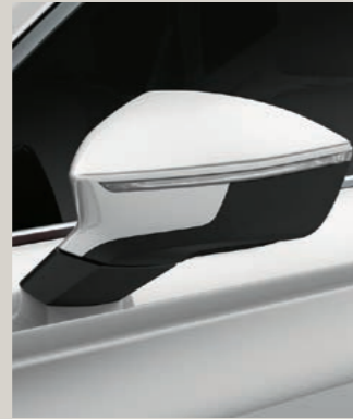
BILA WEISS 1 R St XP