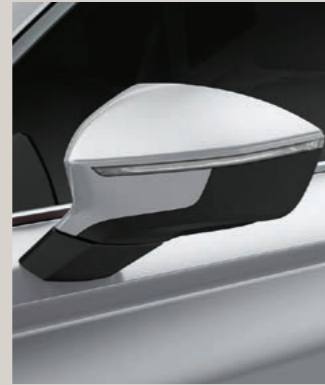
NEVADA WEISS 2 R St XP FR