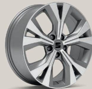
PERFORMANCE II IN ATOM GRAU, GLANZGEDREHT