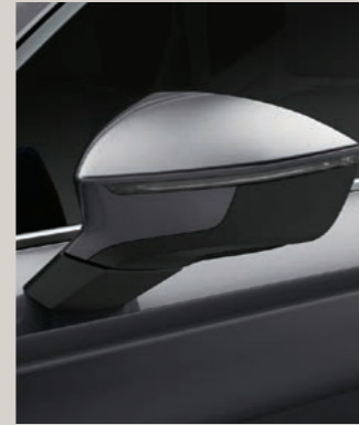
GRAPHITE GRAU 2 R St XP FR