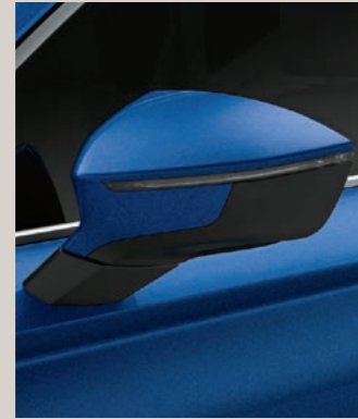
ENERGY BLAU 1 R St XP FR

Reference R Style St Xperience XP FR FR Serie ■ Optional ■