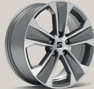
DYNAMIC II IN ATOM GRAU, GLANZGEDREHT