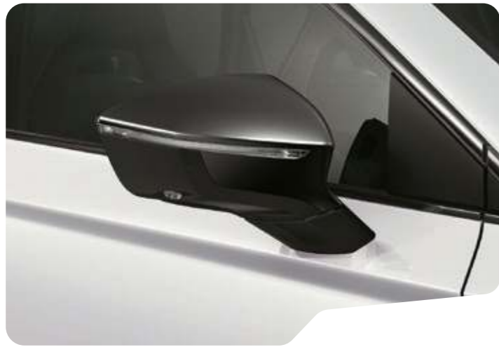
↑ BILA WEISS ◻