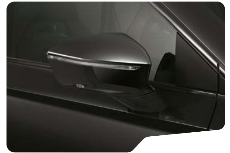
↑ MAGIC SCHWARZ METALLIC ◻