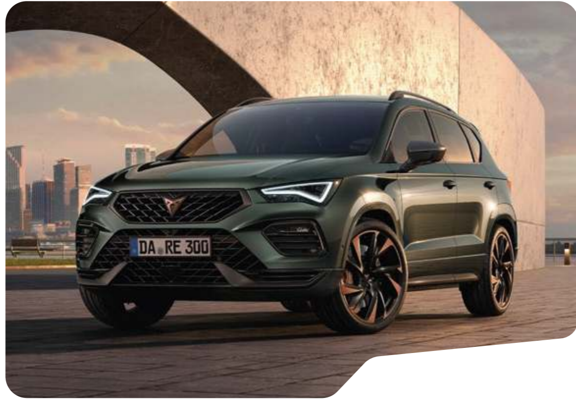
↑ DARK FOREST GRÜN METALLIC ◻