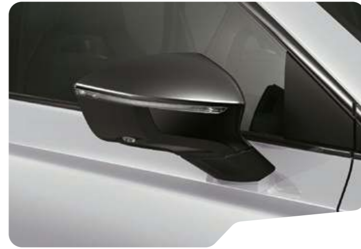
↑ NEVADA WEISS METALLIC ◻