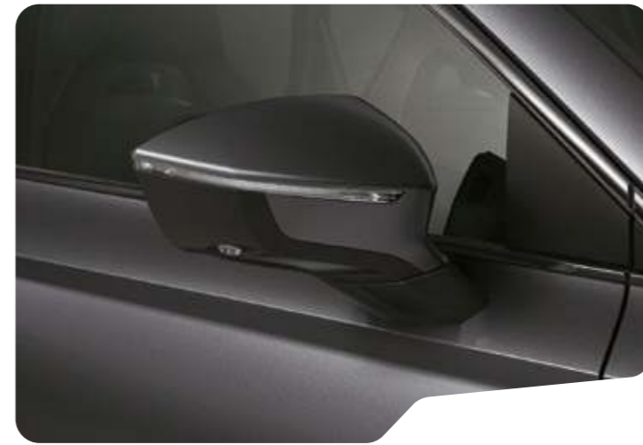
↑ GRAPHITE GRAU METALLIC ◻