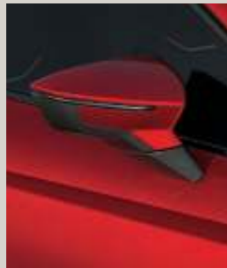
DESIRE ROT 3