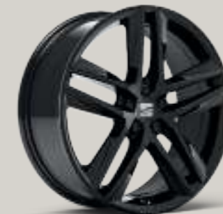
18"-LEICHTMETALLRÄDER „PERFORMANCE BLACK“ 1 FR