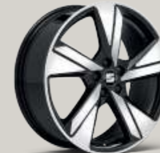
18"-LEICHTMETALLRÄDER „SPORT LINE“, GLANZGEDREHT XC