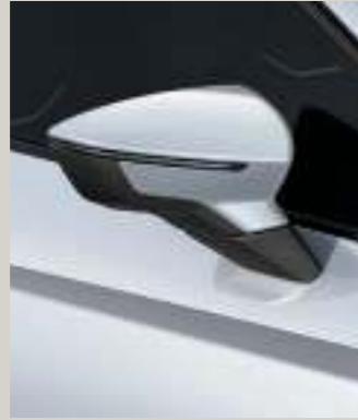
NEVADA WEISS 2