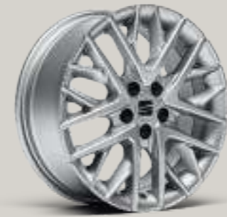
16"-LEICHTMETALLRÄDER „DESIGN 20/1“ XC