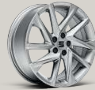
17"-LEICHTMETALLRÄDER „DYNAMIC 20/2“ FR