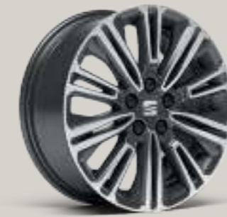
16"-LEICHTMETALLRÄDER „DESIGN 20/3“, GLANZGEDREHT St