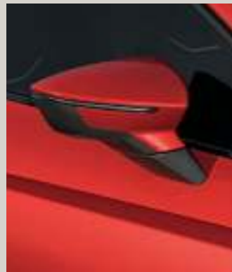
PURE ROT 1