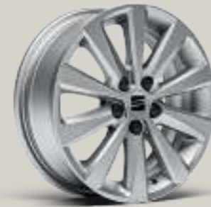
15"-LEICHTMETALLRÄDER „ENJOY 20/1“ St R