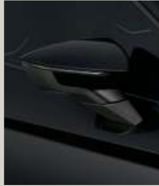
MIDNIGHT SCHWARZ 2