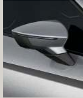
URBAN SILBER 2