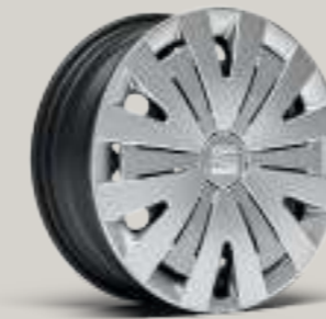
15"-STAHLRÄDER „URBAN 20/1“ R