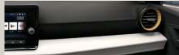
KOMFORT-SITZ-STOFFBEZÜGE COMO IN GRAU/SCHWARZ