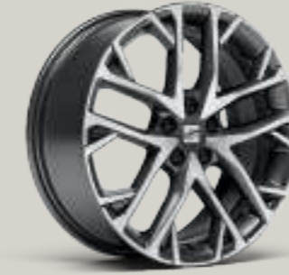
17"-LEICHTMETALLRÄDER „DYNAMIC 20/1“, GLANZGEDREHT XC