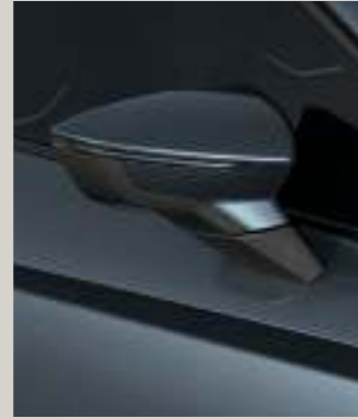
MAGNETIC GRAU 2