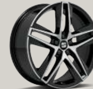
18"-LEICHTMETALLRÄDER „PERFORMANCE 20/1“, GLANZGEDREHT FR