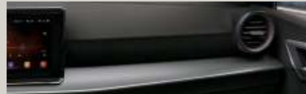
KOMFORT-SITZ-STOFFBEZÜGE NAO IN GRAU