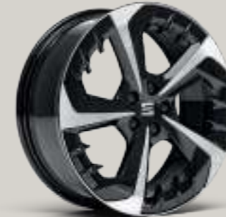
18"-LEICHTMETALLRÄDER „PERFORMANCE 20/4“, GLANZGEDREHT FR