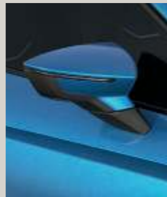
SAPPHIRE BLAU 2