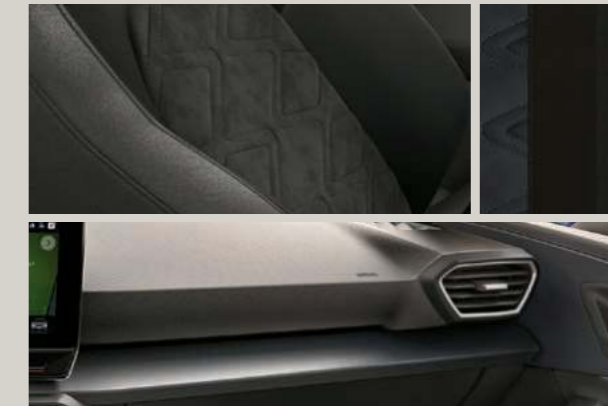
DINAMICA IN SCHWARZ