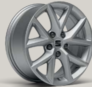
16"-LEICHTMETALLFELGE DESIGN I R St