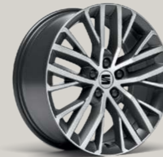
18"-LEICHTMETALLFELGE PERFORMANCE I IN ATOM GRAU, GLANZGEDREHT² XC