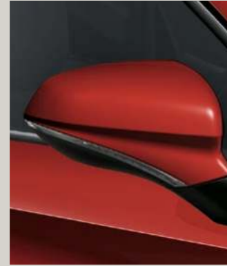
PURE ROT 3 R St XC FR