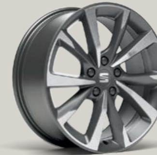
18"-LEICHTMETALLFELGE PERFORMANCE I IN COSMO GRAU, GLANZGEDREHT² FR