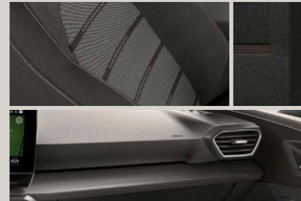
STOFF IN GRAU/BRAUN