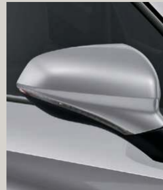
URBAN SILBER METALLIC R St XC FR