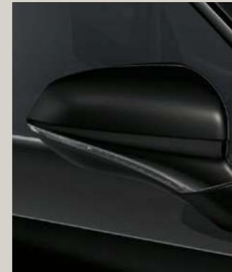
MIDNIGHT SCHWARZ METALLIC R St XC FR

Reference R Style St Xcellence XC FR FR Serie ■ Optional ■