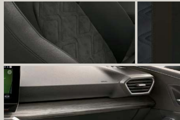
DINAMICA IN SCHWARZ