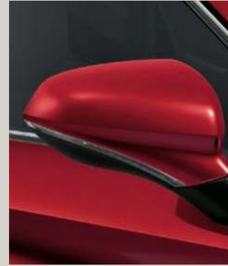
DESIRE ROT METALLIC R St XC FR