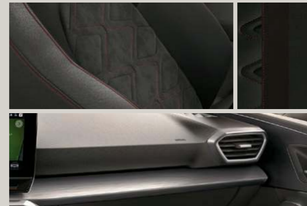
DINAMICA IN SCHWARZ