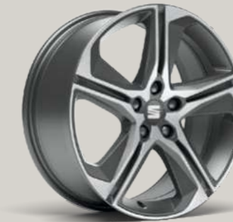
18"-LEICHTMETALLFELGE PERFORMANCE II IN COSMO GRAU, GLANZGEDREHT² FR