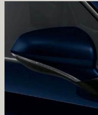
ASPHALT BLAU METALLIC R St XC FR