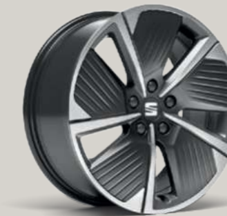
18"-LEICHTMETALLFELGE AERO-DESIGN I IN COSMO GRAU, GLANZGEDREHT² XC