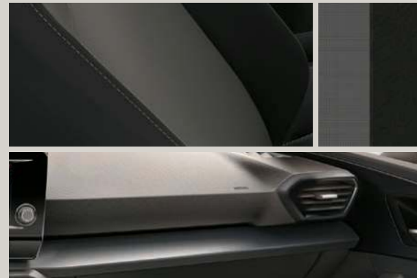
STOFF IN GRAU/SCHWARZ

Reference R Style St Xcellence XC FR FR Serie S Optional O