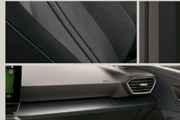
STOFF IN GRAU/SCHWARZ