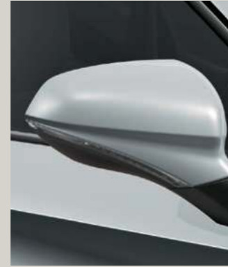
NEVADA WEISS 2 R St XC FR