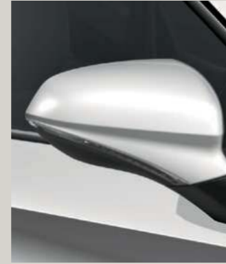
WEISS 1 R St XC FR