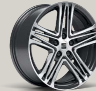
18"-LEICHTMETALLFELGE PERFORMANCE III IN ATOM GRAU, GLANZGEDREHT² XC