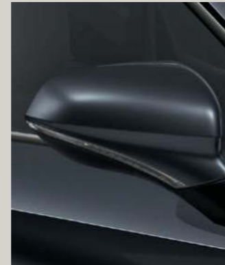
MAGNETIC GRAU METALLIC R St XC FR