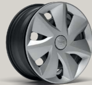
16"-RADVOLLBLENDE URBAN II R