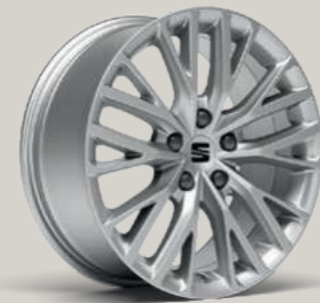
17"-LEICHTMETALLFELGE DYNAMIC I XC