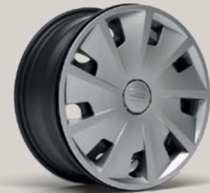
15"-RADVOLLBLENDE URBAN I R