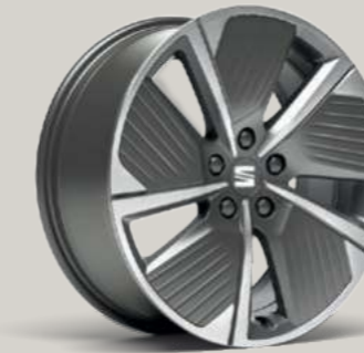
18"-LEICHTMETALLFELGE AERO-DESIGN I IN ATOM GRAU, GLANZGEDREHT² FR