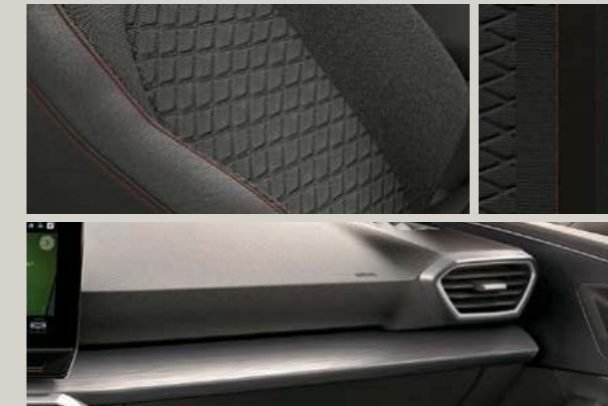
DINAMICA IN SCHWARZ