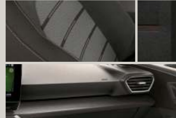
STOFF IN GRAU/BRAUN