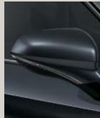
MAGNETIC GRAU METALLIC R St XC FR