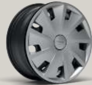
15"-RADVOLLBLENDE URBAN I R