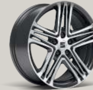
18"-LEICHTMETALLFELGE PERFORMANCE III IN ATOM GRAU, GLANZGEDREHT² XC