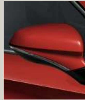
PURE ROT 3 R St XC FR