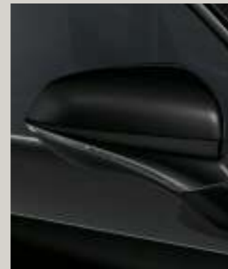
MIDNIGHT SCHWARZ METALLIC R St XC FR