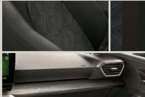
DINAMICA IN SCHWARZ