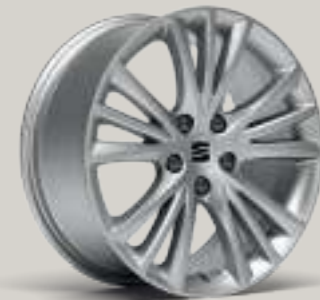
17"-LEICHTMETALLFELGE DYNAMIC III¹ St