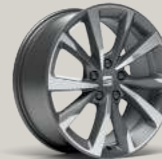
18"-LEICHTMETALLFELGE PERFORMANCE I IN COSMO GRAU, GLANZGEDREHT² FR