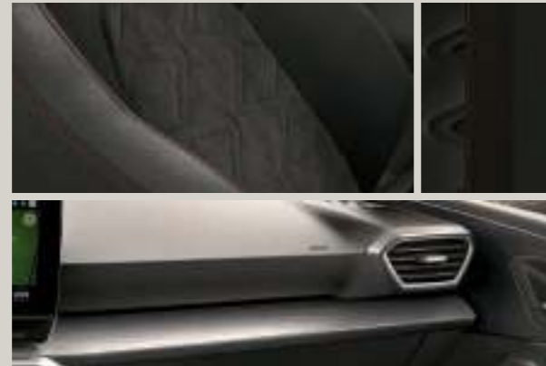
DINAMICA IN SCHWARZ