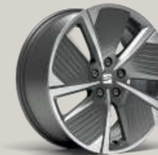
18"-LEICHTMETALLFELGE AERO-DESIGN I IN ATOM GRAU, GLANZGEDREHT² FR