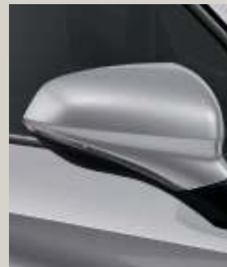
URBAN SILBER METALLIC R St XC FR