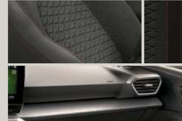
DINAMICA IN SCHWARZ