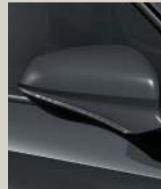
GRAPHENE GRAU 3 FR

Reference R Style St Xcellence XC FR FR Serie ■ Optional ■