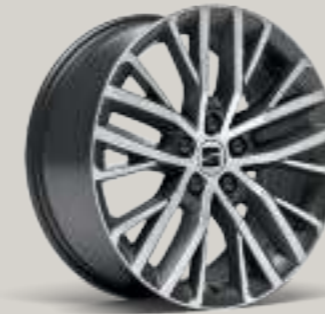
18"-LEICHTMETALLFELGE PERFORMANCE I IN ATOM GRAU, GLANZGEDREHT² XC