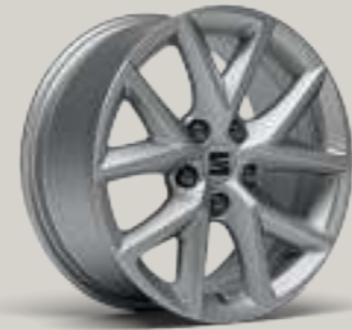
16"-LEICHTMETALLFELGE DESIGN I R St