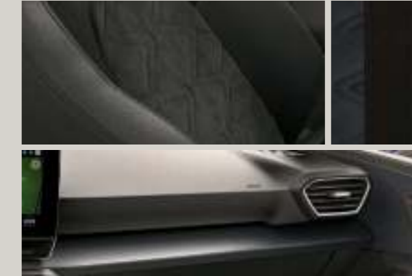
DINAMICA IN SCHWARZ