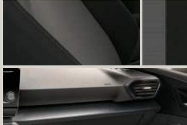
STOFF IN GRAU/SCHWARZ

Reference R Style St Xcellence XC FR FR Serie S Optional O