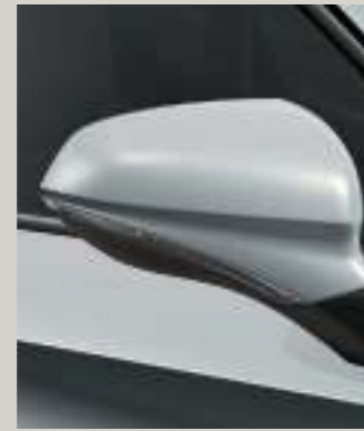
NEVADA WEISS 2 R St XC FR