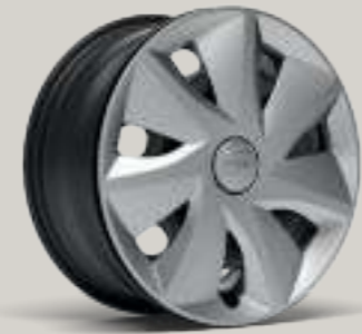
16"-RADVOLLBLENDE URBAN II R