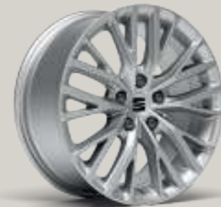
17"-LEICHTMETALLFELGE DYNAMIC I XC