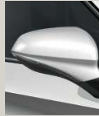
WEISS 1 R St XC FR