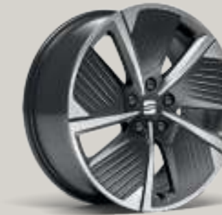
18"-LEICHTMETALLFELGE AERO-DESIGN I IN COSMO GRAU, GLANZGEDREHT² XC