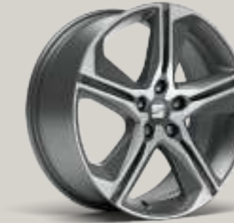
18"-LEICHTMETALLFELGE PERFORMANCE II IN COSMO GRAU, GLANZGEDREHT² FR