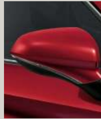
DESIRE ROT METALLIC XC FR