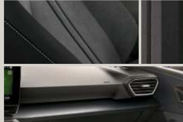
STOFF IN GRAU/SCHWARZ