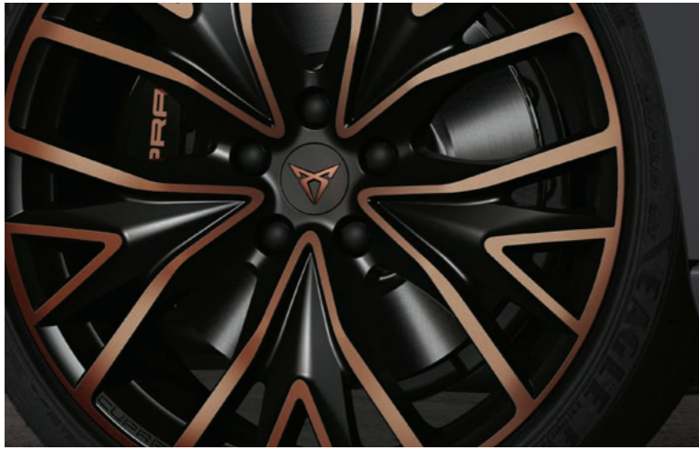
19" EXCLUSIVE II BLACK/COPPER, GLANZ- GEDREHT 1