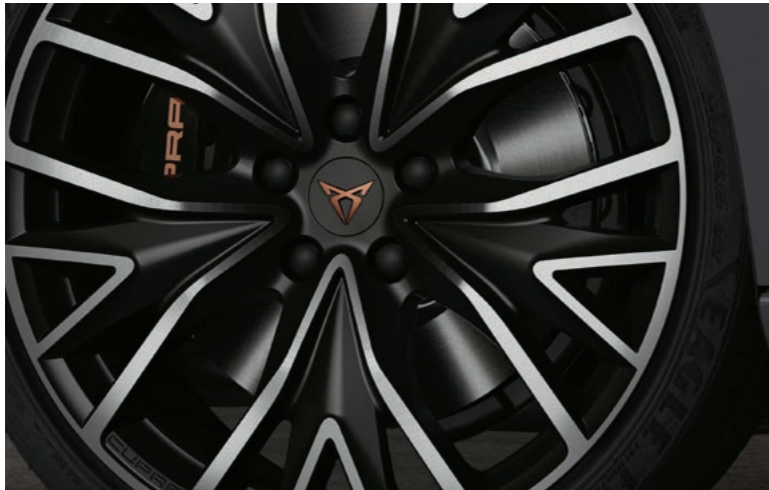
19" EXCLUSIVE II BLACK/SILBER, GLANZ- GEDREHT 1