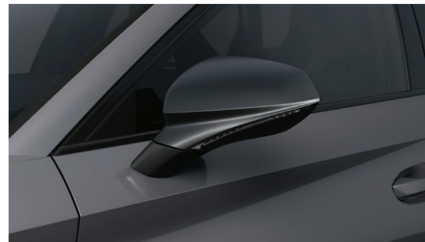
GRAPHENE GRAU 1