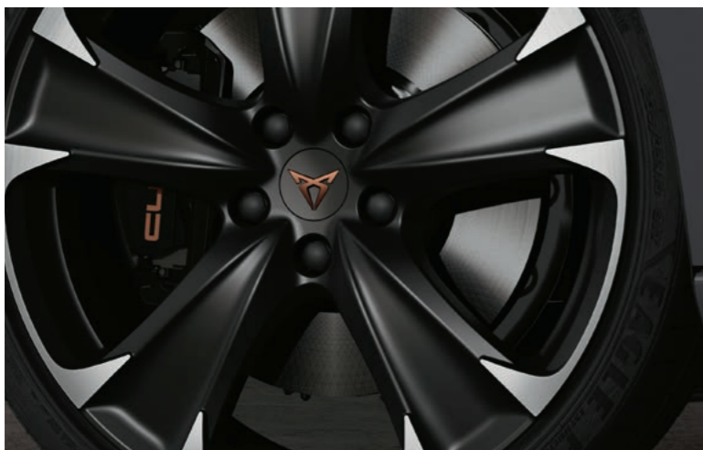
19" EXCLUSIVE I BLACK/SILVER, GLANZ- GEDREHT