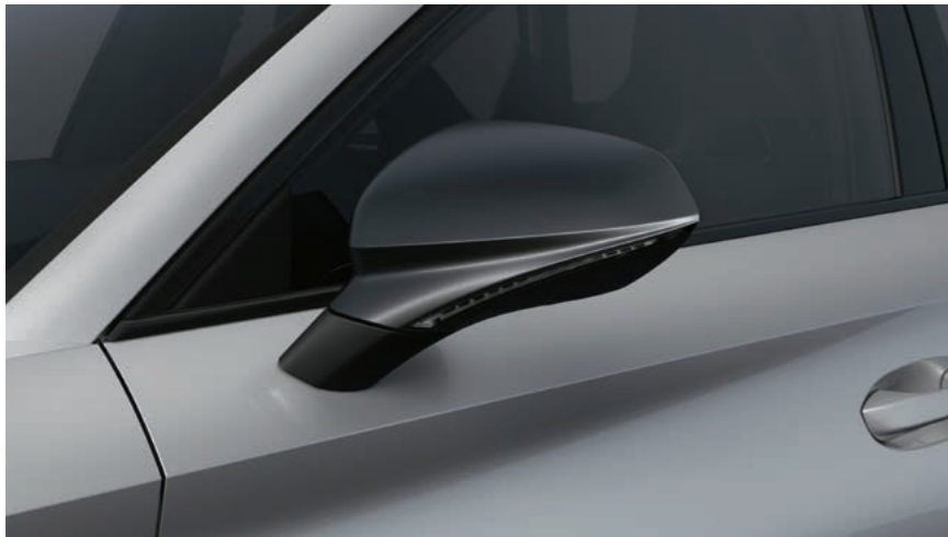
URBAN SILBER 1