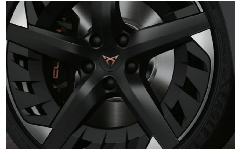
19" EXCLUSIVE AERO I BLACK/SILVER, GLANZ- GEDREHT 1