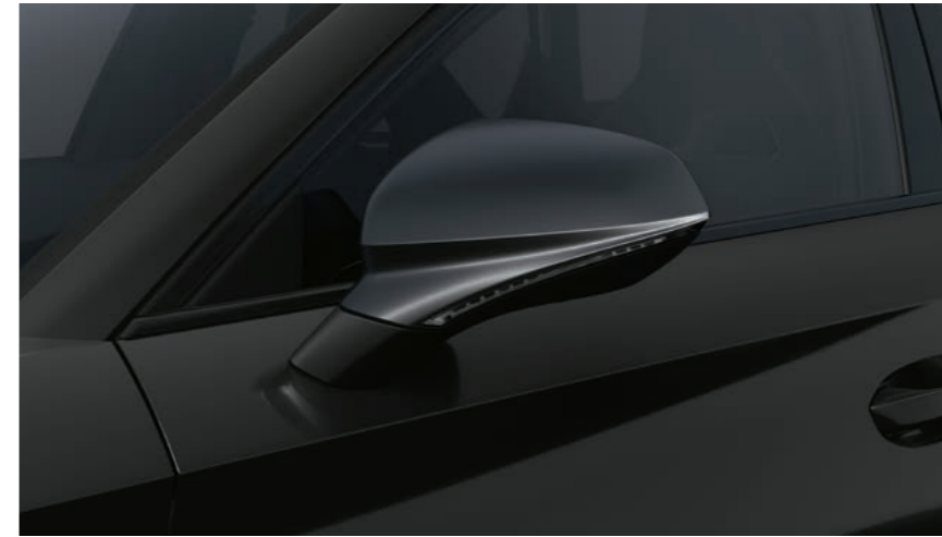
MIDNIGHT SCHWARZ 1