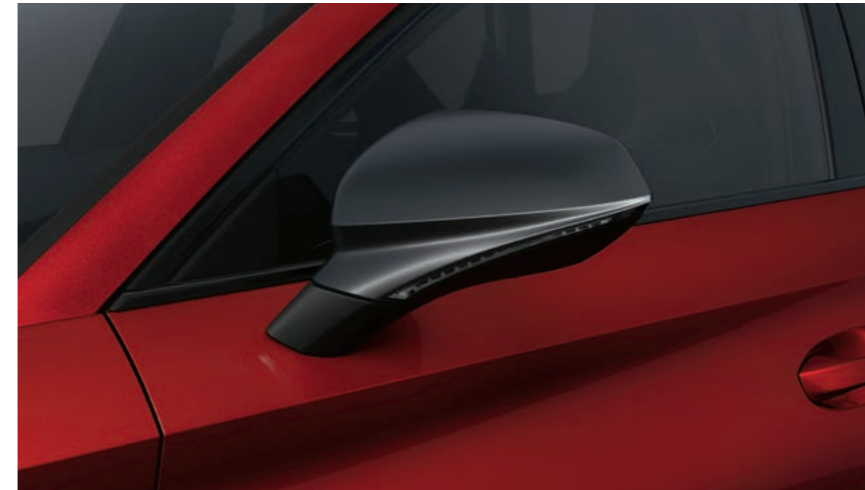
DESIRE ROT 1