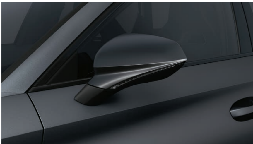
MAGNETIC GRAU 1