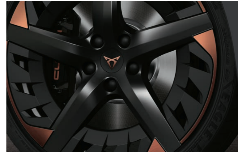
19" EXCLUSIVE AERO I BLACK/COPPER, GLANZ- GEDREHT 1