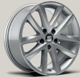
17"-LEICHTMETALLRAD DYNAMIC St