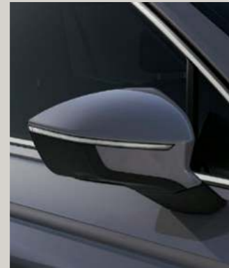
DELPHIN GRAU METALLIC St XC FR