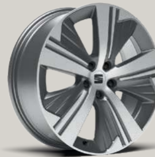
19"-LEICHTMETALLRAD EXCLUSIVE AERO GLANZGEDREHT XC