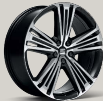
20"-LEICHTMETALLRAD SUPREME GLANZGEDREHT XC