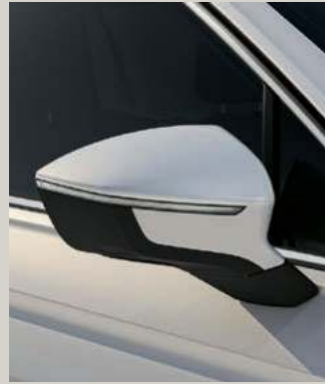
ORYX WEISS METALLIC St XC FR

Style St Xcellence XC FR FR Serie ■ Optional ■