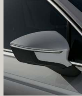
REFLEX SILBER METALLIC St XC