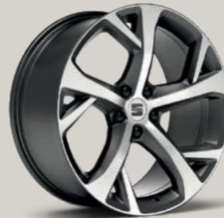
19"-LEICHTMETALLRAD EXCLUSIVE II GLANZGEDREHT FR