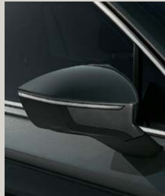
DARK CAMOUFLAGE METALLIC St XC FR