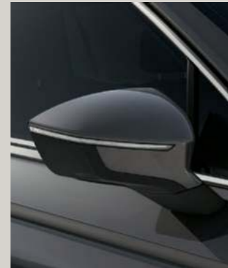
URANO GRAU St XC FR