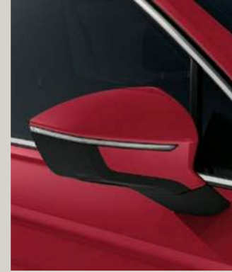
MERLOT ROT METALLIC St XC FR