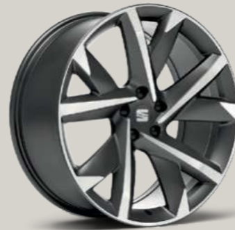
20"-LEICHTMETALLRAD SUPREME II GLANZGEDREHT FR

Style St Xcellence XC FR FR Serie ■ Optional ■