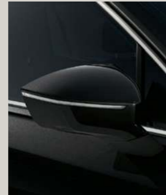
DEEP SCHWARZ METALLIC St XC FR