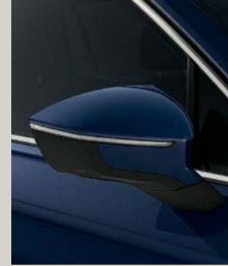
ATLANTIC BLAU METALLIC St XC