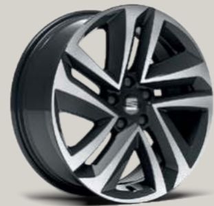
18"-LEICHTMETALLRAD PERFORMANCE GLANZGEDREHT St